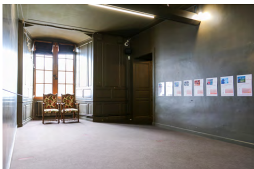
aile sud, chambre 1, mur ouest, avant travaux