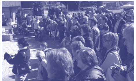
Durant les deux jours, près de 3'000 personnes ont visité la manifestation: ici la présentation du bétail, un moment toujours fort apprécié.

su apprécier cette plate-forme de rencontres et d'échanges à destination aussi bien des acteurs de l'économie alpestre et forestière, que du grand public.