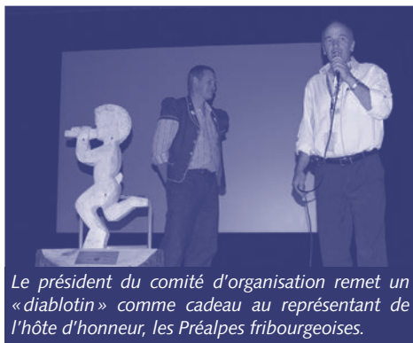
Le président du comité d'organisation remet un « diablotin » comme cadeau au représentant de l'hôte d'honneur, les Préalpes fribourgeoises.