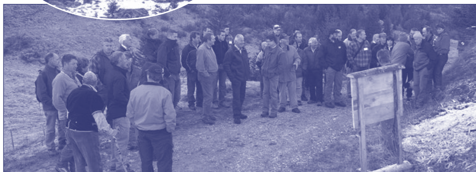
La problématique de l'entretien des alpages et de l'avancement de la forêt a été démontré et a pu être discuté dans le terrain lors de l'excursion sur l'alpage du Pillon.