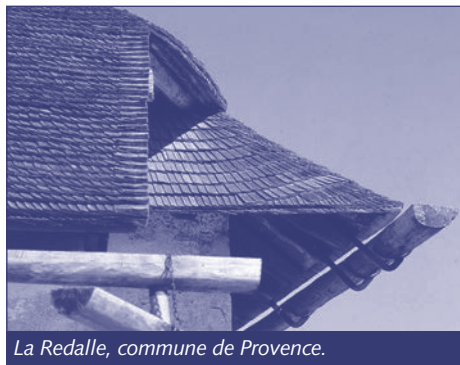
La Redalle, commune de Provence.

priétaire du fonds, a été entreprise en 2011. Le coût des travaux a été pris en charge par l'Établissement cantonal d'assurance contre l'incendie et les éléments naturels.