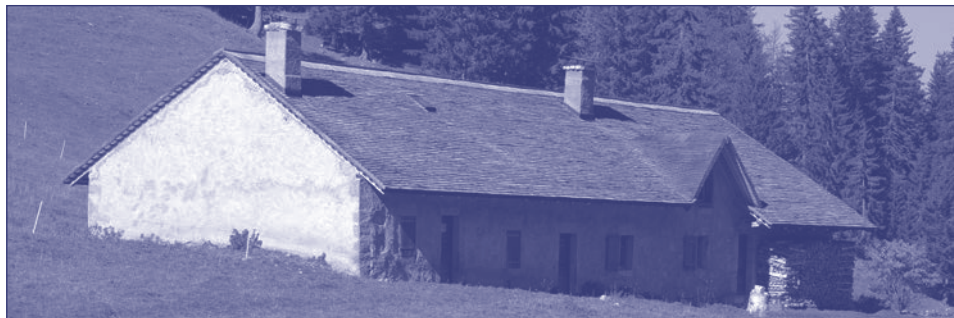
Le chalet du Creux-du-Croue, commune d'Arzier.