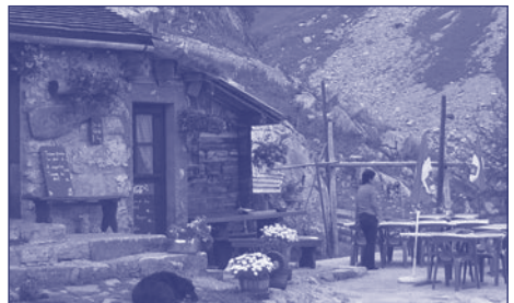
Les offres touristiques comme la restauration ou l'hébergement, doivent rester limitées en termes de places assises et de lits.

L'OAT ne contient aucune disposition exécutoire au sujet de cette problématique. Dans les explications de l'Office fédéral du développement territorial connues à ce jour se trouvent cependant quelques précisions. Plus particulièrement, l'activité accessoire dans un centre d'exploitation temporaire n'est admissible que pen-