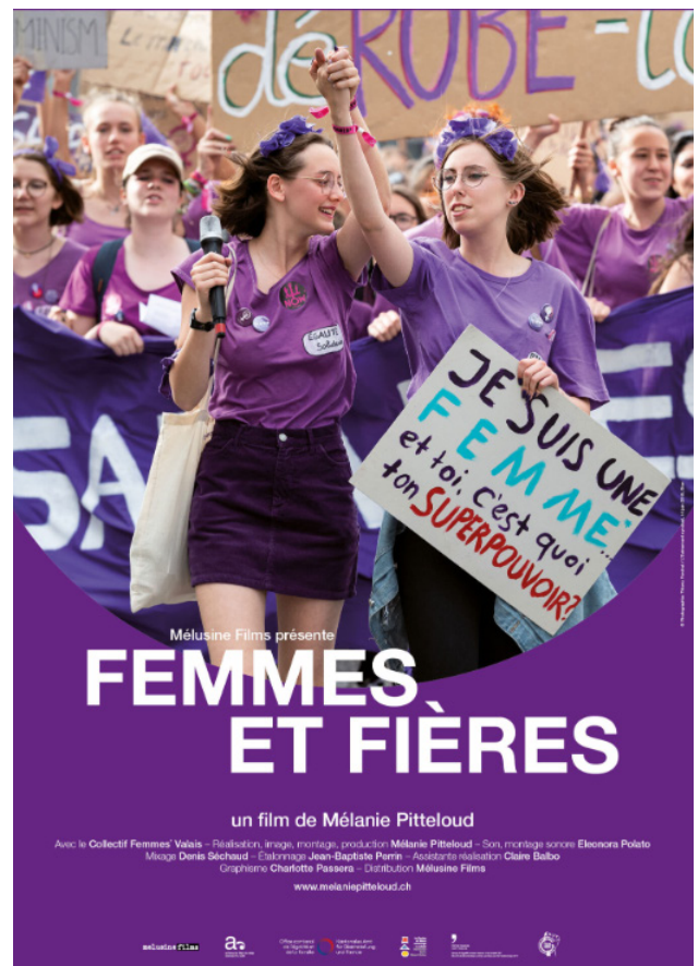
Affiches des films, réalisées par Charlotte Passera