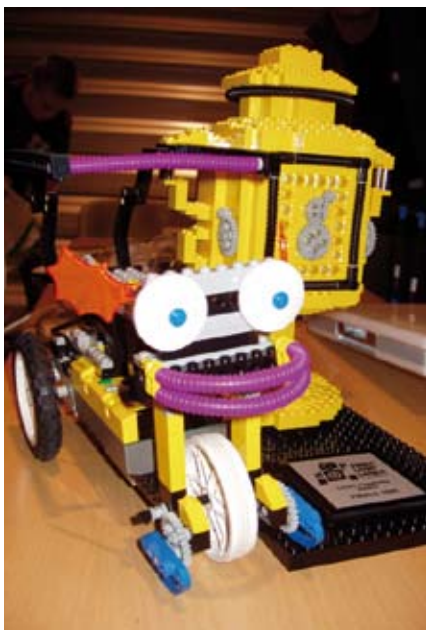
Le robot Joe et la coupe de la créativité gagnée par l'équipe yverdonnoise