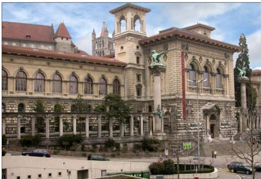
Le Palais de Rumine, haut-lieu des musées vaudois