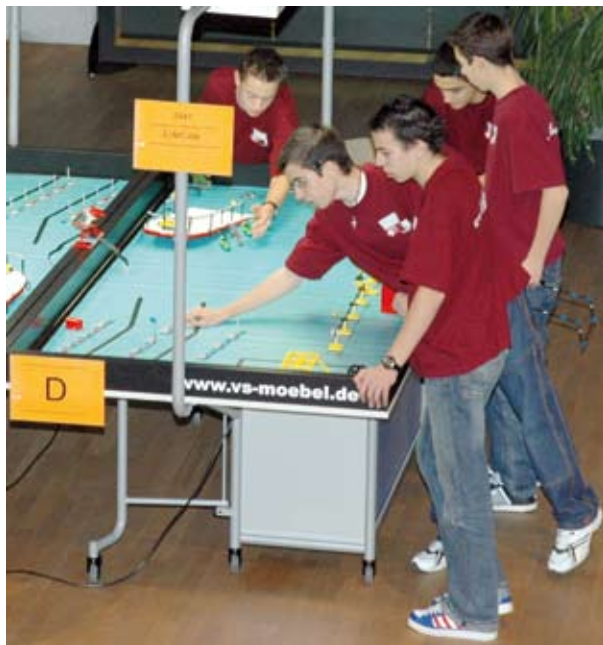
L'équipe yverdonnoise en pleine préparation sur le «terrain de jeu» de leur robot

En trois manches : le robot doit exécuter seul une série de missions ; par exemple, pousser un drapeau, ramener un container vers la base de départ, faire tomber un dauphin, déplacer un sous-marin... A cela s'ajoutait un exposé devant des experts, une interview, la présentation du design du robot. Toutes les épreuves étaient notées.