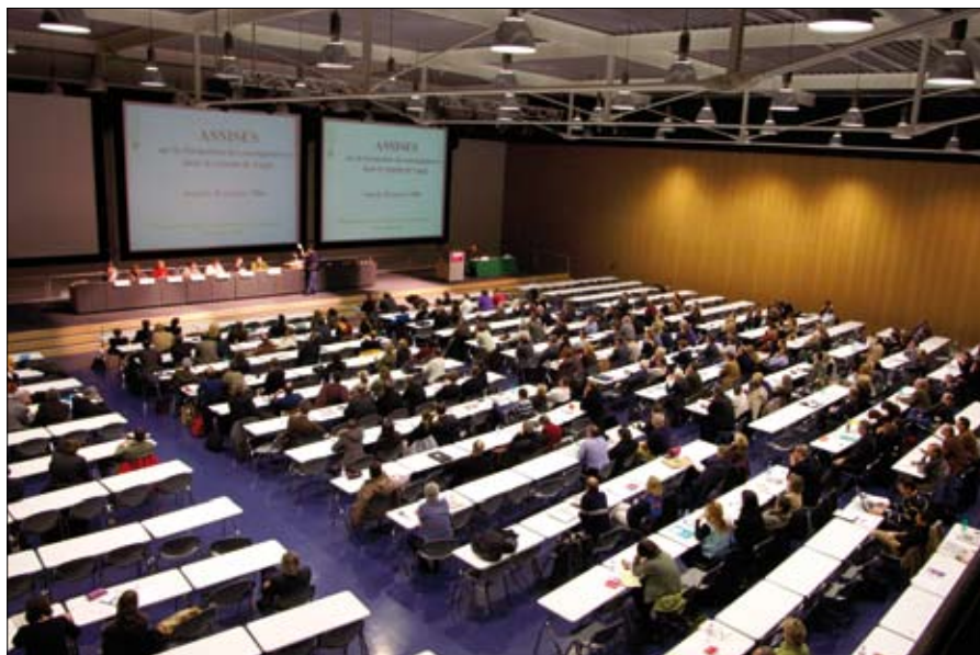
La première journée de débat s'est déroulée à Dorigny, à l'Amphimax, le 12 novembre.

La participation aux journées de réflexion du Forum s'effectue sur inscription, mais reste néanmoins ouverte à toute personne intéressée. Vous trouvez les informations nécessaires sur le site Internet du Département de la formation et de la jeunesse à l'adresse: http://www.dfj.vd.ch