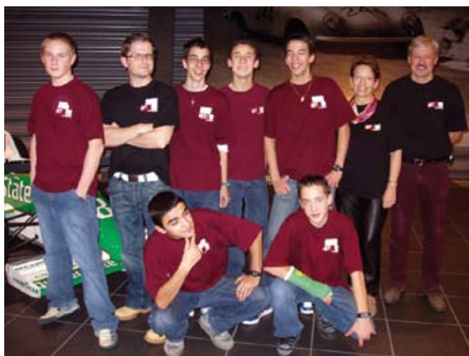
L'équipe au complet et leurs accompagnants