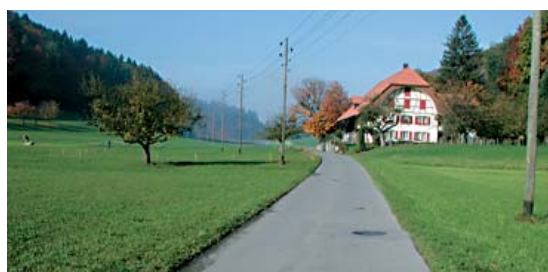
Route secondaire à faible circulation sans trottoir et sans chemin pour piéton/piste cyclable