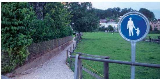
Chemin pour piéton