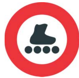
Circulation interdite aux engins assimilés à des véhicules