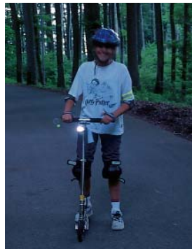
Équipement de nuit et par mauvaise visibilité

éclairage bien visible, blanc à l'avant et rouge à l'arrière.