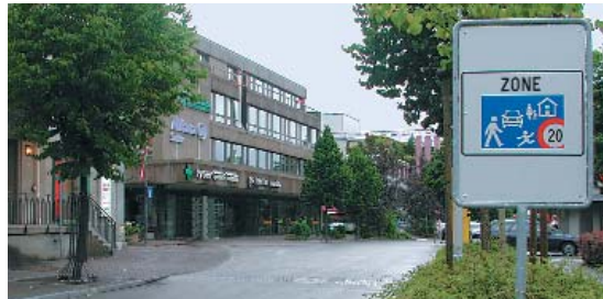
Zone de rencontre

Surfaces autorisées à la circulation des engins assimilés à des véhicules