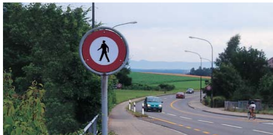
Accès interdit aux piétons