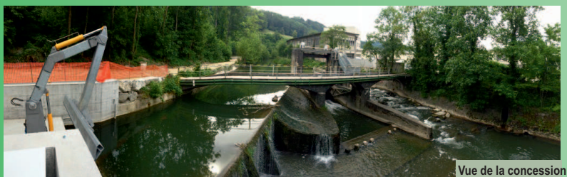
Vue de la concession

Coûts des travaux TTC et honoraires : 450'000.-