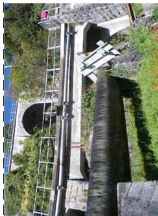
Les ouvrages Sous les Farettes 1 à 2 (ci-dessus) et Sous les Caudrey (ci-dessous) sont à assainir en 2011.