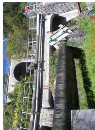
Les ouvrages Sous les Farettes 1 à 2 (ci-dessus) et Sous les Caudrey (ci-dessous) sont à assainir en 2011.