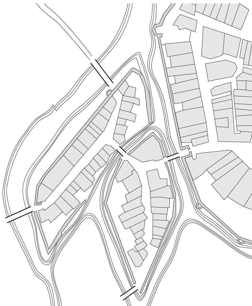
Plan du Faubourg de Gleyres et de Cheminet d'après Georges Kasser, Revue historique vaudoise , 1952

Le bâtiment des anciennes casernes a été construit sur le site d'un ancien faubourg de la ville apparu au début du XIV e siècle, appelé faubourg de Gleyres et de Cheminet.