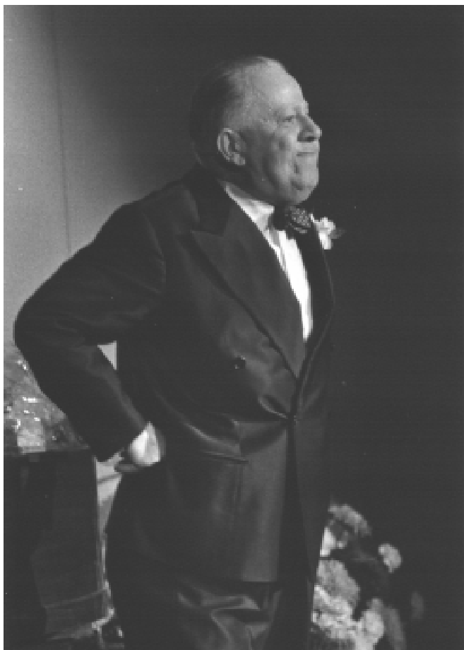
Jean Villard-Gilles exprime tout le XX e siècle vaudois, mais est avant tout un chantre des valeurs universelles. Ses archives font désormais partie du domaine public.

S eize ans après la mort de Jean Villard-Gilles, sa veuve fait entrer dans le domaine public l'ensemble des archives de son mari: publications, correspondances, photographies, dessins, affiches, partitions, manuscrits et discographie. L'ensemble de la donation représente 3,60 mètres linéaires; elle est immédiatement accessible dans la salle de lecture des Archives cantonales vaudoises.