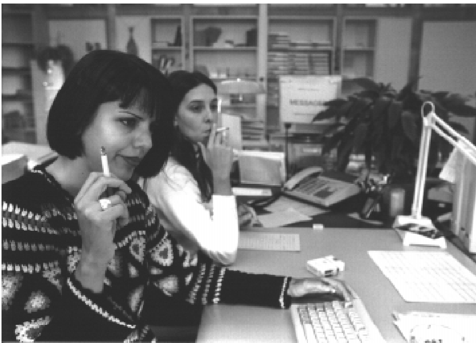
Tous les goûts se retrouvent en matière de tabac dans l'administration cantonale.

Presque tout le monde a fait le service militaire, l'état d'esprit est plus naturellement à la discipline, je crois que cela facilite les choses. Même les dames s'y sont mises.»