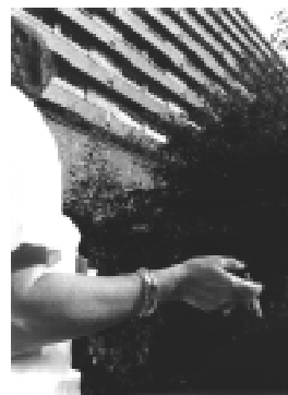
Au CHUV: fumer dehors, à l'occasion.