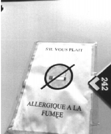
L'attitude des non-fumeurs varie de cas en cas...