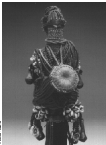
Poupée Fali (Cameroun), collection Horstmann

Pour les enfants seulement: fabrication du pain, de bols, jarres et amphores selon des techniques anciennes me 5, je 6 et ve 7 janvier.