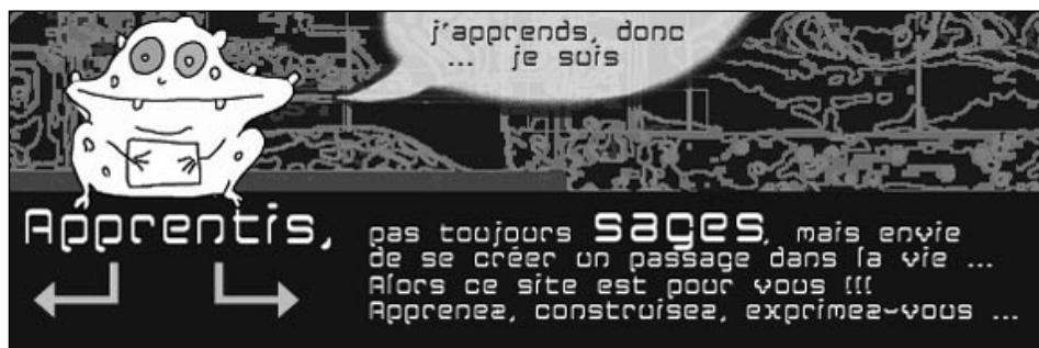
La nouvelle ligne graphique du site des apprentis (page d'accueil) est née de l'imagination d'une apprentie, Lara Estoppey.

Le classeur de l'apprenti publié en 2000 fait peau neuve et devient le site passage.vd.ch .