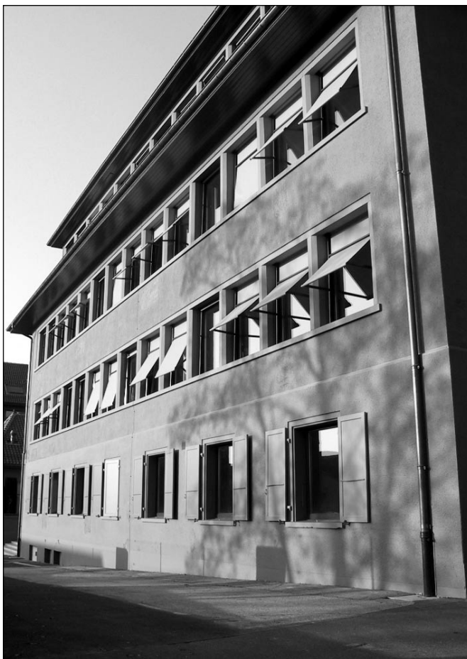
Façades, stores et volets détonnent d'un orange soutenu... malheureusement escamoté par le noir-blanc de l'illustration.

Le SERAC est le petit dernier à avoir grimpé sur le navire. «C'était une question d'opportunité», explique Brigitte Waridel, qui a saisi l'offre de la Ville de Lausanne, propriétaire du bâtiment, qui voulait louer le plus rapidement possible une série de