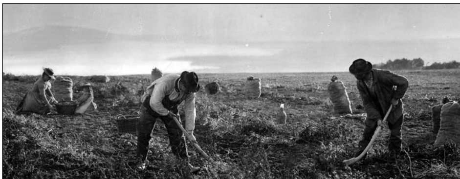
Photographie anonyme prise lors de la récolte des pommes de terre à Bougy sur Rolle, vers 1903.