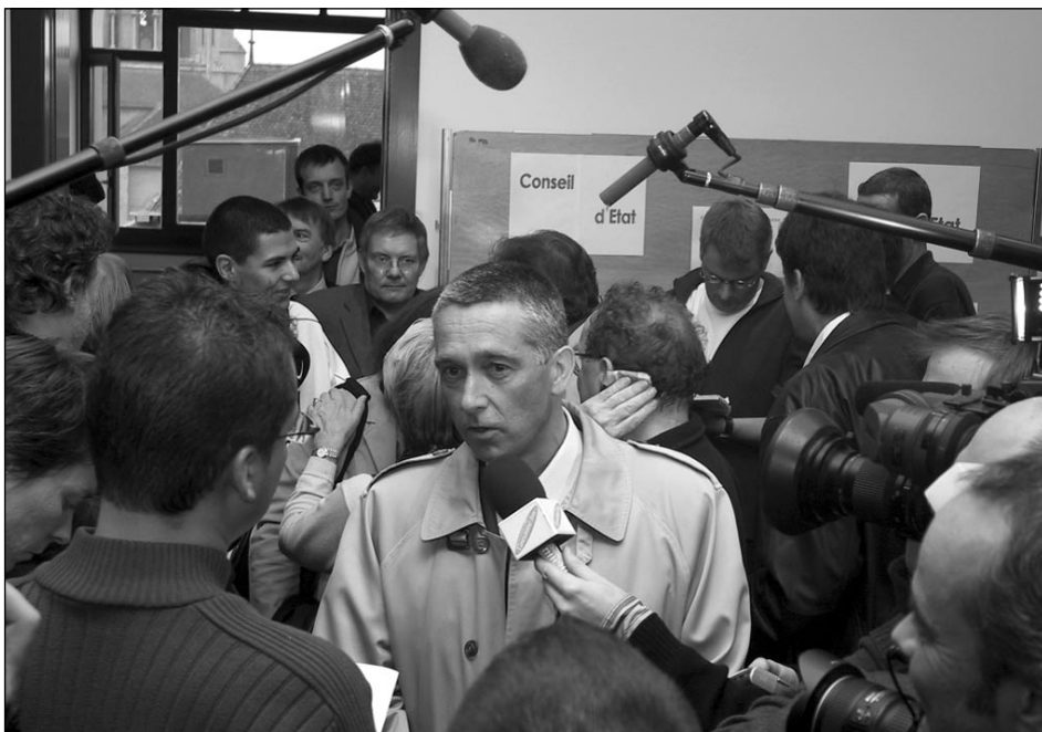
François Marthaler, sorti en tête de la course à la succession de Philippe Biéler, très entouré le 9 novembre à la Salle du Bicentenaire. Le résultat définitif de l'élection complémentaire au Conseil d'Etat était publié à 16h15.

Pour la première fois dans le canton, toutes les opérations liées aux élections fédérales ainsi qu'à une élection complémentaire au Conseil d'Etat ont été conduites par des outils informatiques. Toutes les communes ont saisi les bul-