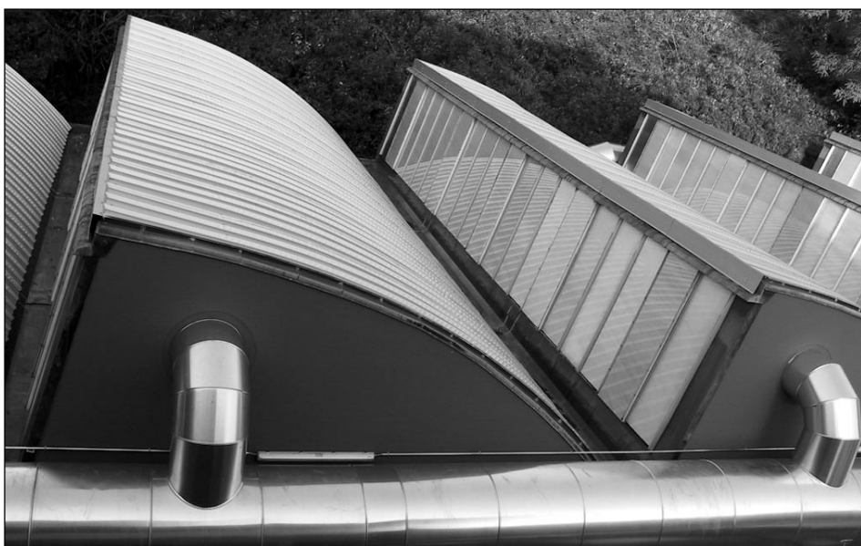
«La manufacture: établissement où la qualité de la main d'œuvre est primordiale». La volonté de conserver son architecture et son nom au bâtiment ainsi que le choix des illustrations qui parsèment la brochure de l'école et son site (outils du tailleur de pierres précieuses) soulignent la filiation entre le passé industriel du lieu, l'effervescence présente et le devenir des étudiants.