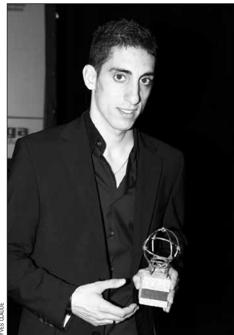
Sébastien Buemi, sport automobile, Mérite du sportif 2009.

Le mérite peut aussi être décerné au Service de l'éducation physique et du sport qui, grâce à cet événement, permet à des clubs ou à des sportifs d'horizons divers (escrime, moto-cross freestyle, VTT, ski, F1, etc...) de se rencontrer et créer, l'espace d'une soirée, une grande plate-forme d'échanges. – CP