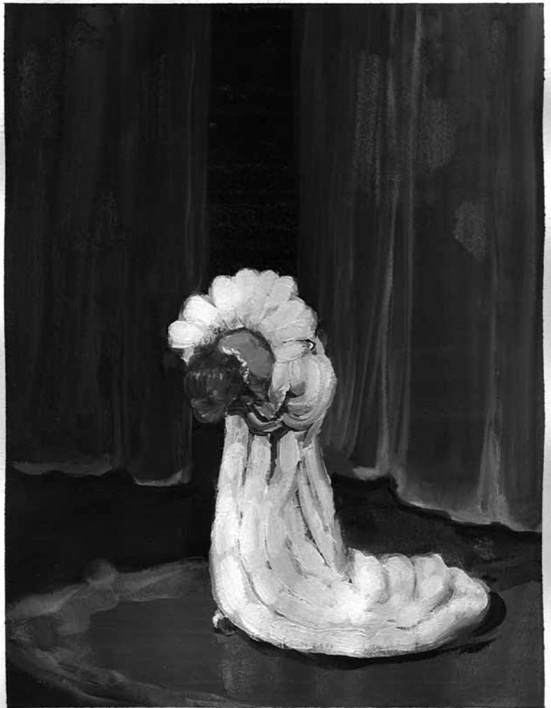
Elisabeth Llach. Ne t'inquiète pas , 2007. Acrylique sur papier, 24 x 19 cm.