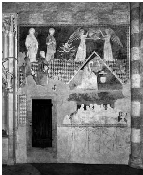
L'un des principaux ensembles de peintures médiévales de Suisse.

Ces pages consacrées à l'Abbatiale de Romainmôtier retracent l'histoire de l'édifice religieux, des origines (les vestiges d'une première église du VI e ou VII e siècle ont été retrouvés lors des fouilles de 1905)