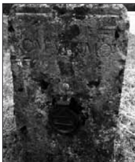
Borne sur la route allant de Montcherand à Lignerolle.