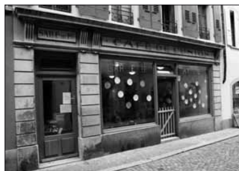
À Lutry, la garderie qui vous invite au Café de l'Union.