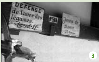
L'hygiène n'a pas de prix.