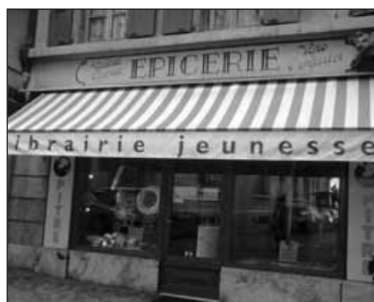
Du tabac et des vins à l'emporter dans cette librairie jeunesse à Lutry?