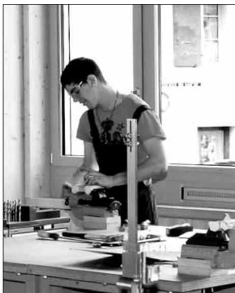
Atelier de mécanique au COFOP