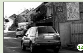
Quand les voitures avaient des pattes.