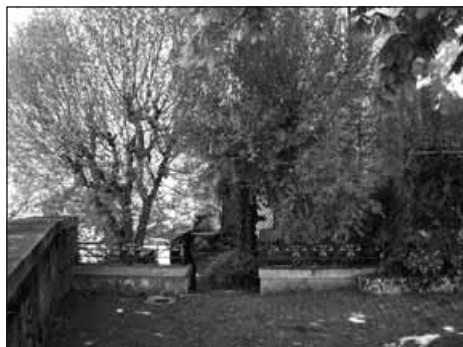
Clarens, château du Châtelard.

> Clarens-sur-Montreux, ch. de Planchamp-Dessous 1, visites libres ou commentées, de 10h à 17h.