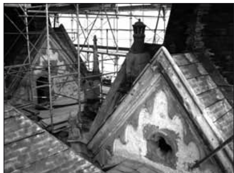
Vevey, château de l'Aile.

> Vevey, Grande Place, visites libres et guidées, de 10h à 17h.