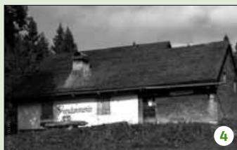
Les braconniers sont avertis.