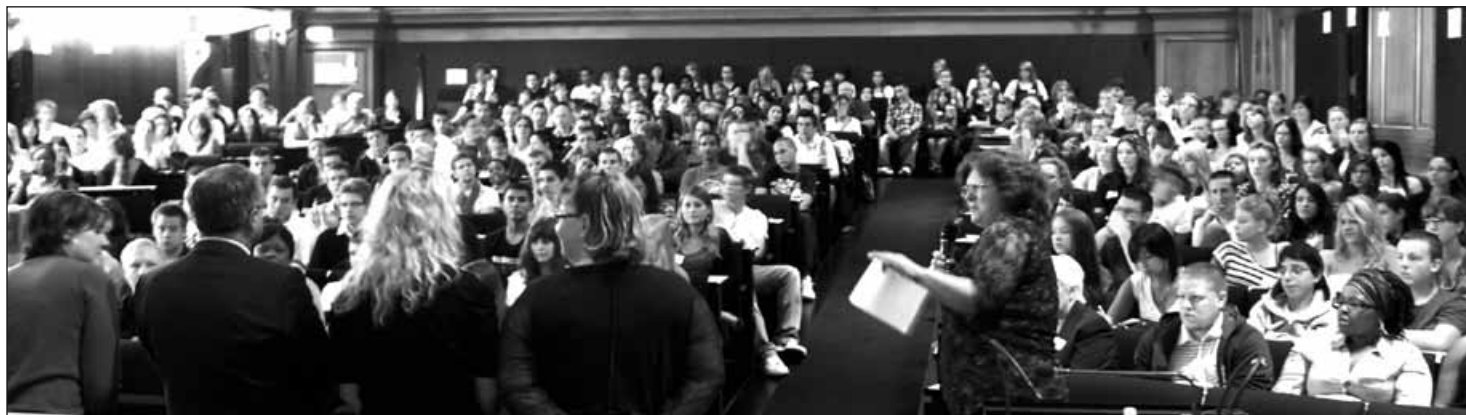
Journée des nouveaux apprentis dans la salle du Grand Conseil: les RAD (responsables des apprentis départementaux) font face à 250 nouveaux visages.

Plus de 250 jeunes commencent un apprentissage dans l'administration cantonale. L'Etat appelle les entreprises à créer des places d'apprentissage, et prêche par l'exemple.