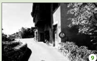
Voir la photo de détail en page une.