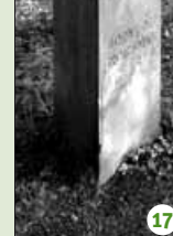
Deux communes et l'Évêque pour un bois.