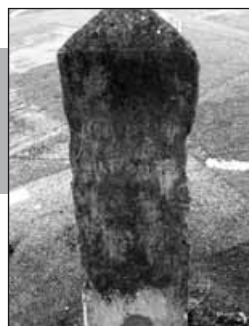
À Bretonnières, borne en prisme indiquant Orbe, Vallorbe et Jougne.