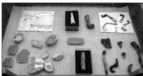
Une infime partie des trouvailles réalisées durant la fouille publique de cet été.

d'entretien. Minutieux, le travail s'apparente à l'enquête policière. Comme pour ces pieds de lit en bronze aux pièces marquées de lettres grecques aidant à leur montage. Les seuls exemplaires semblables proviennent de Délos et sont datés du 1 er siècle avant JC, soit plus de 200 ans avant l'utilisation de ces lits dans le Palais Derrière la Tour. «Se trouve-t-on en présence