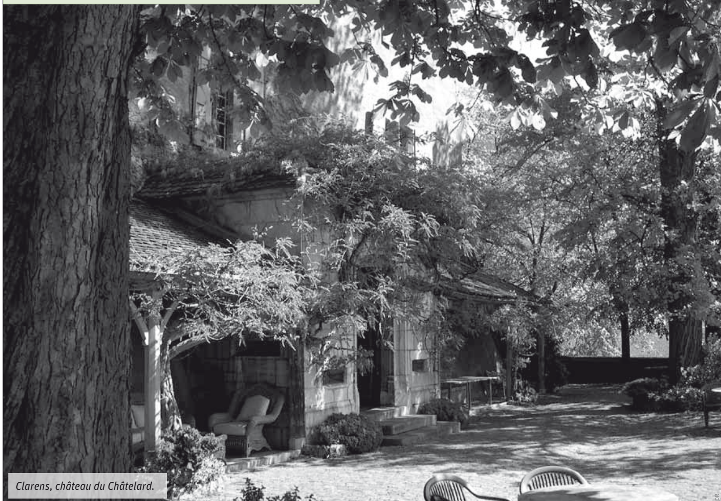
Clarens, château du Châtelard.

En 2009, le canton de Vaud a accueilli plus de 22 000 visites sur les 22 sites proposés. Au-delà de cette fréquentation réjouissante, c'est la qualité des échanges et l'atmosphère chaleureuse qui donna à ces journées toute leur saveur, pour le plus grand plaisir d'un public attentif et reconnaissant. Professionnels, spécialistes, propriétaires, utilisateurs et amateurs de tous horizons, réunis autour du patrimoine, contribuent année après année avec enthousiasme à la réussite de ces journées.