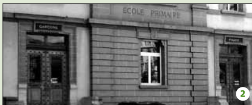
Une entrée pour les filles, une autre pour les garçons.