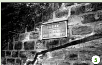
À hauteur de coche.