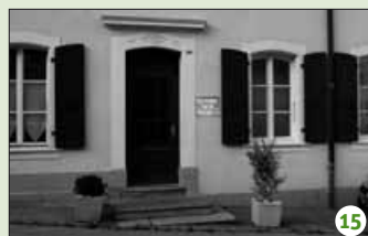
Disciplinez vos bovins et essuyez-vous les pieds.