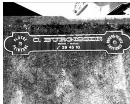
À l'époque des numéros de téléphone à 6 chiffres... Lutry, rue du Bourg.