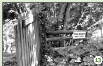
Pas d'eau dans ce canal...