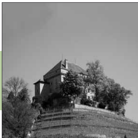
Clarens, château du Châtelard.

septembre permettra de découvrir aussi des monuments eux-mêmes.