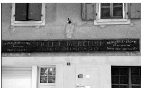
Enseigne à La Chaux-sur-Cossonay.