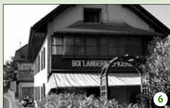
Pas de pain ni d'épices à vendre ici.