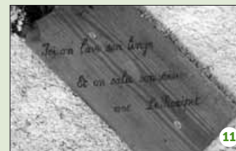
Le temps pour des bavardages venimeux...