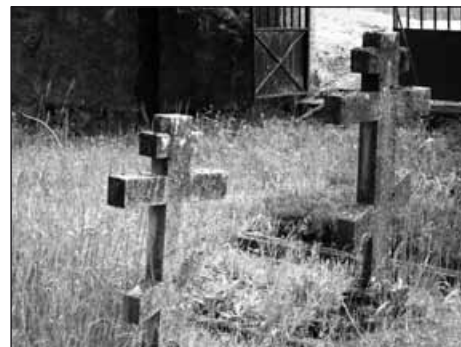
Sépultures à Assens.

> Village d'Assens et alentours, visites libres et commentées, conférences et balades, de 10h à 17h.