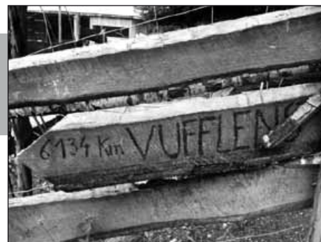
«Vufflens, 6134 km», lit-on sur ce panneau, à Saint-Fulgence (près de Chicoutimi), au Québec.