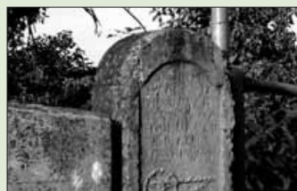
«La loi défend d'enreyer sans sabot et de mener du bois en traîne».