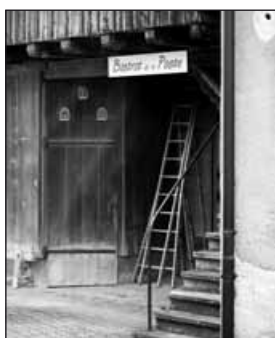
Bremblens, bistrot de la poste.