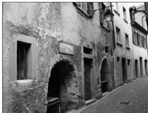
Lutry, rue Verdaine, enseigne de l'ancien télégraphe.