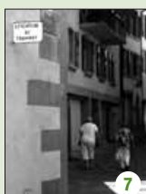
Les rails ont disparu.