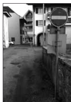
Cossonay, sens interdit, puis Stop!