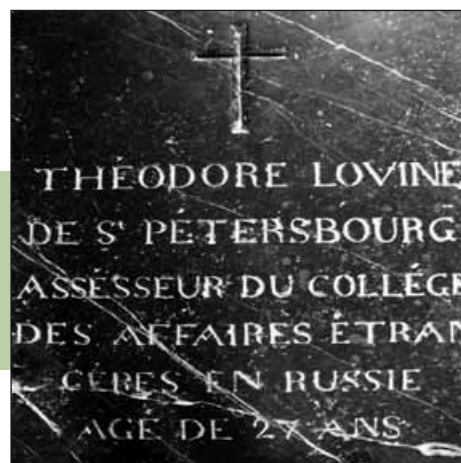
Dalle funéraire à Assens.