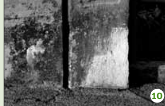
«La loi défend d'enreyer sans sabot et de mener du bois en traîne».