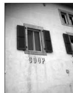
Ancienne Coop à Valeyres-sous-Rance.