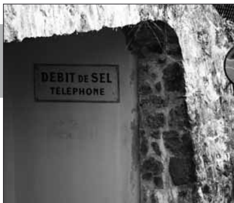
Bremblens, débit de sel et téléphone.