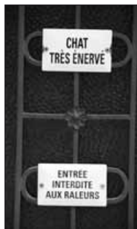
À Lutry, où les chats s'échaudent...