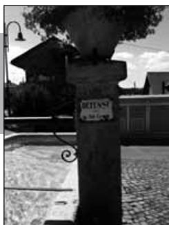
«Défense de salir l'eau» à cette fontaine, à Croy.