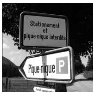
Panneaux indicateurs divergents au lieu dit de la Gittaz d'en bas sur la commune de Sainte-Croix. (photo transmise par Pascal Pittet)