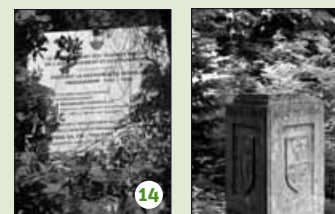
Avis officiel du DTPAT.