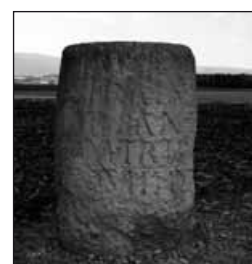
Borne milliaire dans la cluse d'Entreroches, sur une voie romaine conduisant à Avenches, sous Trajan