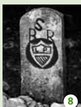
Des initiales énigmatiques.