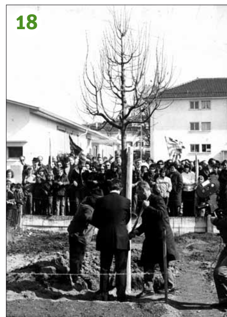
1973 - Etagnières: le 14 avril, plantation symbolique d'un tilleul avant le référendum sur la construction d'un aéroport « intercontinental » (l'arbre des opposants en signe de calme et de tranquillité, contre le bruit promis par la proximité future de l'aéroport...)