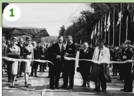
1964 - Lausanne: inauguration de l'Exposition nationale le 30 avril. Louis Guisan (président du Conseil d'Etat), Gabriel Despland (président de l'Expo, Georges-André Chevallaz (syndic de Lausanne).