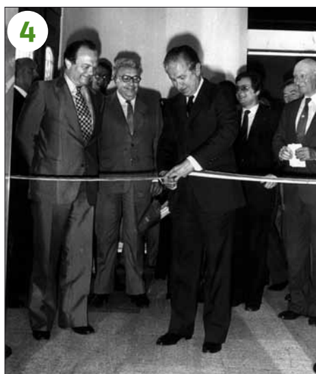
1982 - Lausanne: inauguration du Musée olympique à l'av. Ruchonnet, le 23 juin. Juan-Antonio Samaranch, président du CIO, coupe le ruban.