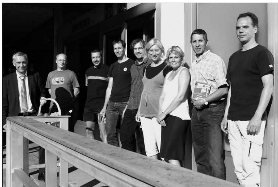
Le chef du DINF François Marthaler a remis leurs prix à quatre équipes.

Tous les collaborateurs de l'Etat de Vaud étaient invités à participer, pendant le mois de juin, à l'action «À vélo au boulot». Cette action de Pro Velo Suisse rencontre chaque année plus de succès. Au total, ce sont six millions de kilomètres, réalisant une économie de 1200 tonnes de CO 2 , qui ont été «pédalés» dans l'ensemble du pays.