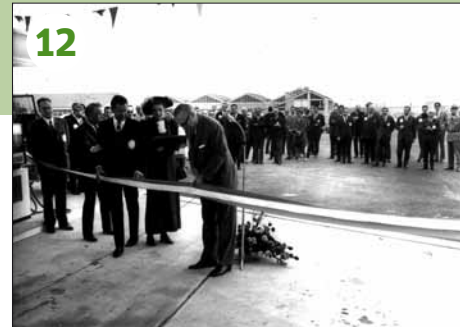
1969 - Bursins: inauguration du centre autoroutier, le 11 octobre. Les personnages ne sont pas nommés dans l'archive photographique...