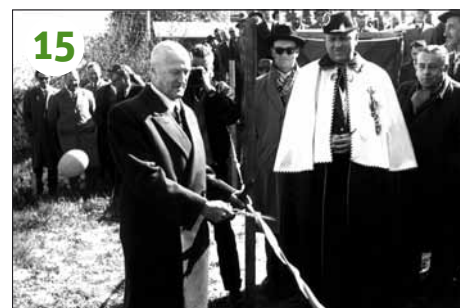
1959 - Aubonne: premier coup de pioche des autoroutes suisses (A1), le 22 avril, près du futur pont de l'Aubonne. Le conseiller fédéral Philipp Etter tient les ciseaux.