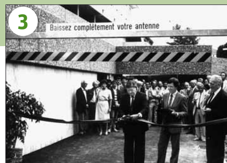
1986 - Lausanne: inauguration du parking du CHUV le 17 juin. Claude Perey, conseiller d'Etat, coupe le ruban.