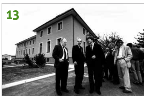
1990 - Orbe: inauguration de la «section ouverte» aux EPO, le 20 avril, en présence des conseillers d'Etat Jean-François Leuba et Claude Ruy.