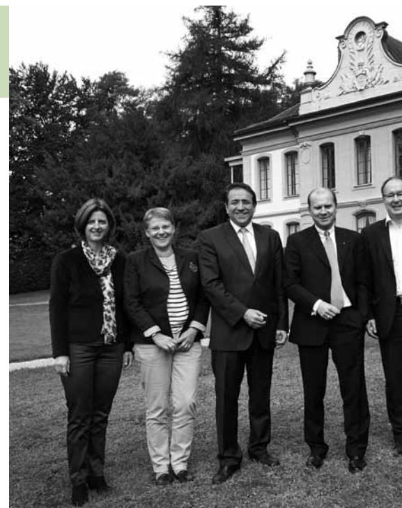
Le Conseil d'Etat, entouré de la vice-chancelière et du chancelier,

100 millions d'investissements en plus Pour mettre en œuvre ce programme, la planification financière 2014-2017 prévoit une enveloppe dont les effets cumulés et progressifs pourront atteindre 210 millions de francs en 2017, ainsi qu'une augmentation des investissements nets de 300 à 400 millions environ. La montée en puissance des investissements et des prêts, ainsi que les résultats planifiés laissent prévoir une dette se montant à quelque 3,1 milliards de francs en 2017.