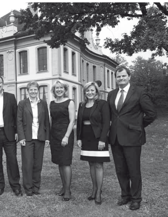
devant la maison de l'Élysée.