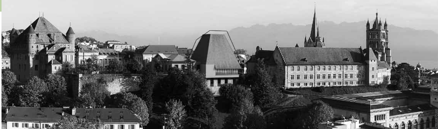
Photomontage. Le volume global (gabarit initial indiqué en trait noir) a été réduit de 30% par rapport au projet initial.

Les Autorités vaudoises ont dévoilé les modifications architecturales du projet, qui tiennent compte des principales critiques des référendaires.