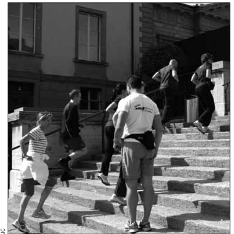
Des séances d'entraînement ont été proposées.