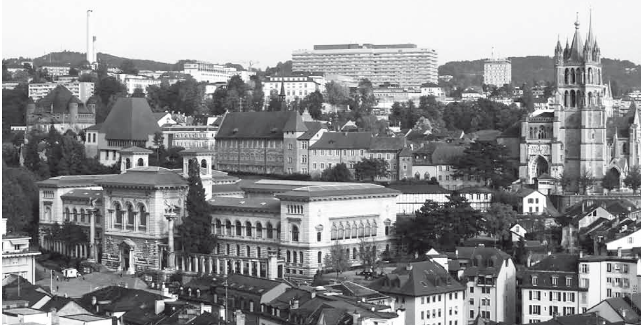
Photomontage. La révision du projet de parlement exprime la volonté d'une meilleure intégration sur la colline de la Cité.

D es plans revus pour le projet de reconstruction du parlement ont été présentés le 13 novembre. Ils traduisent la volonté des Autorités vaudoises de mieux intégrer le bâtiment au site. Avec un toit plus sobre, d'un volume réduit de quelque 30% par rapport au projet initial et couvert de tuiles, le bâtiment ne voit