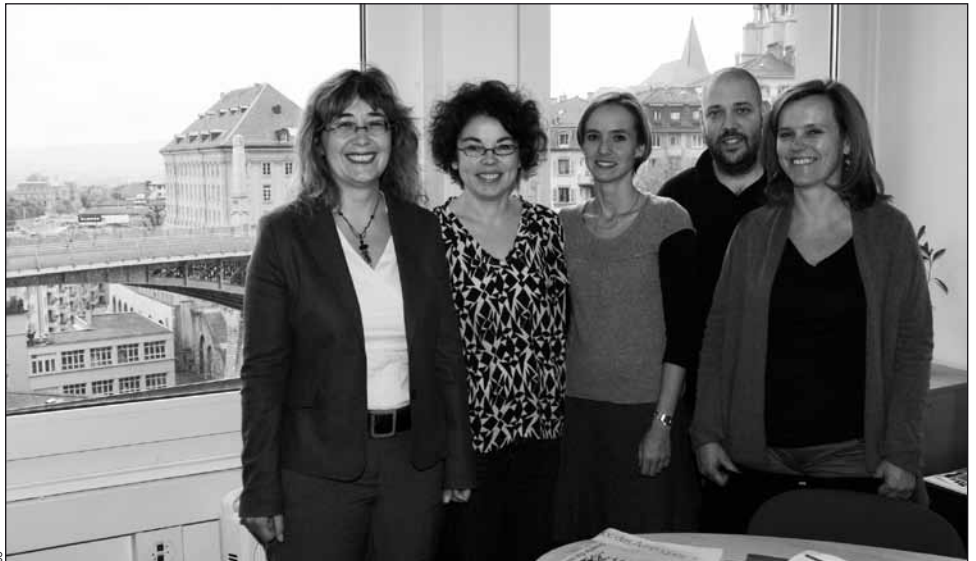
L'équipe du Bureau de l'égalité entre les femmes et les hommes (BEFH) a effectué le plus grand nombre de pas.

Neuf entités ont participé pour la première fois à l'action «Ça marche!» cette