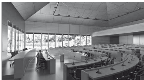
Les députés retrouveront un hémicycle propice à leurs débats.