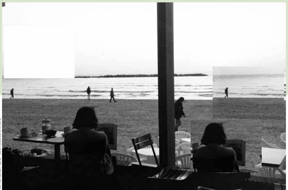
Des morceaux d'images se superposent dans la série «Irréparable», 1986-2000. Photographie noir-blanc.