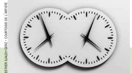
Les Inséparables, double-horloge, 2000-2010.