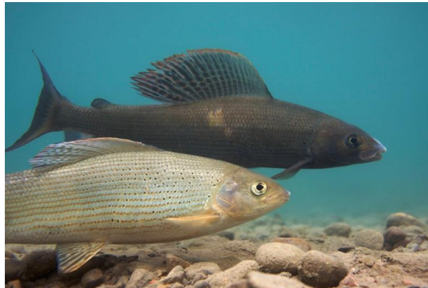
Ombre commun