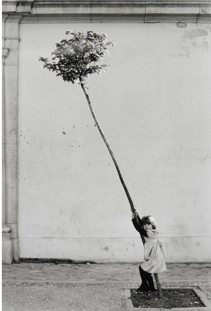
Petite fille, petit arbre, 1981