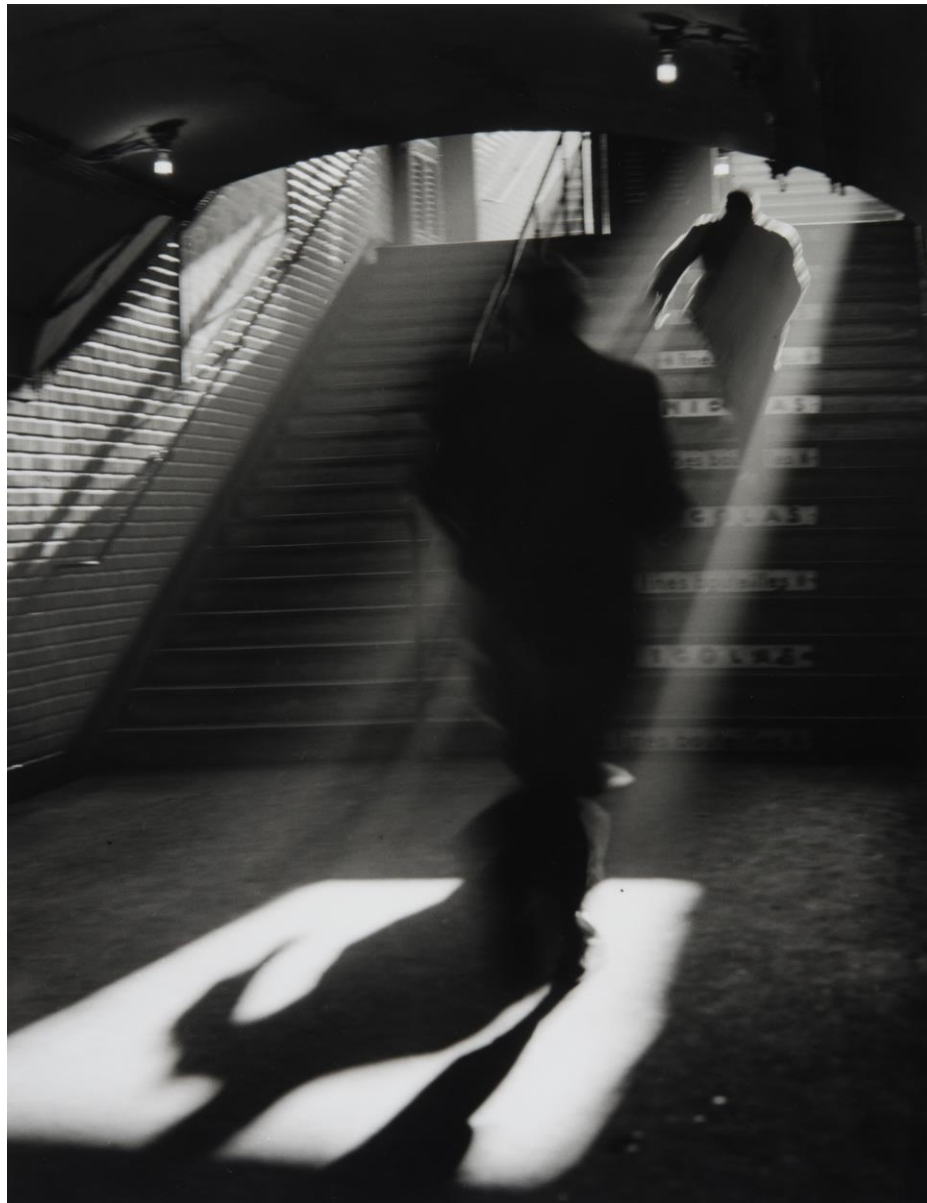
Sortie de métro, Paris, 1955