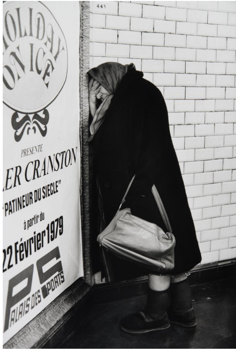
Métro de Paris, 1959