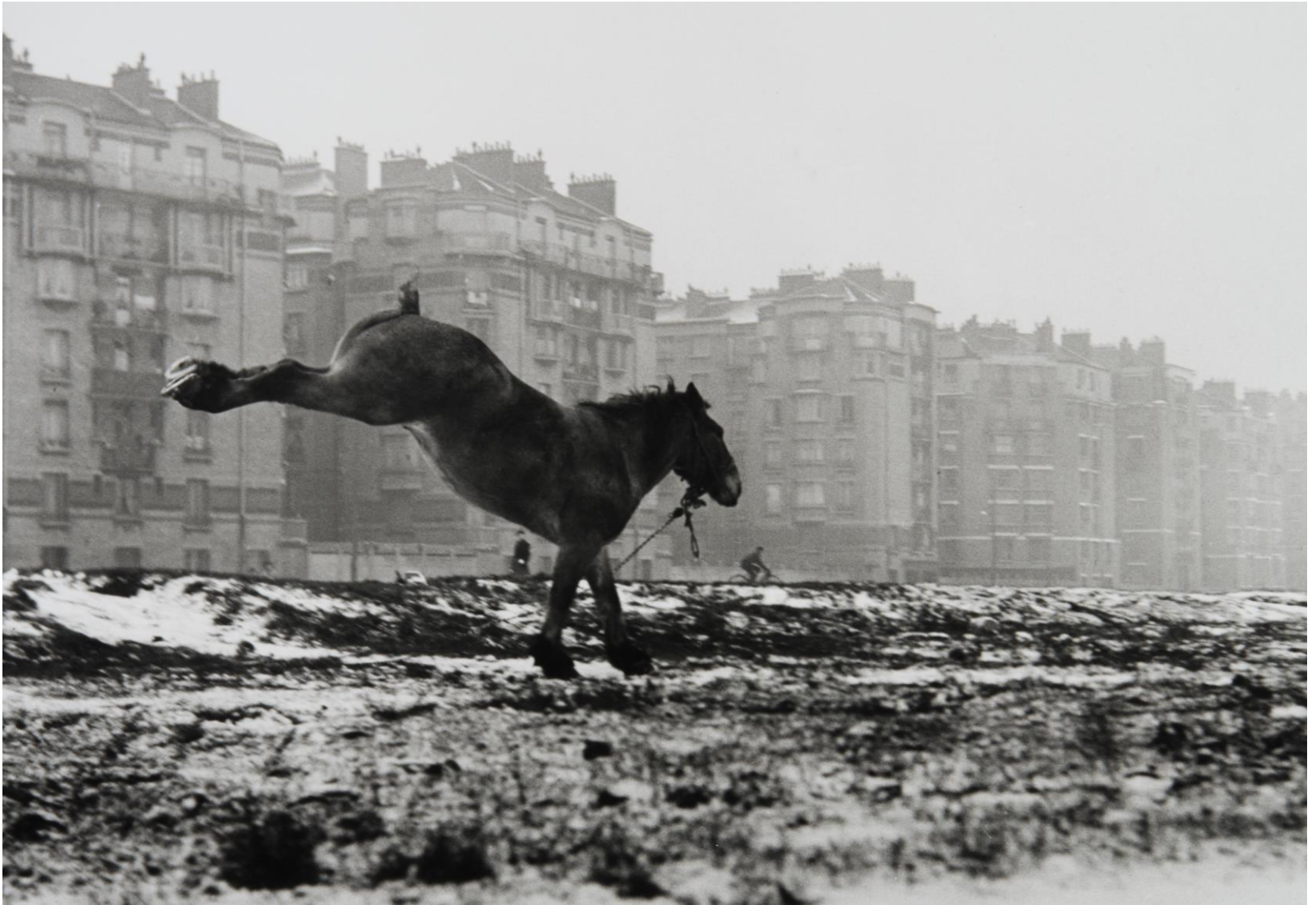
Cheval ruant, porte de Vanves, 1953