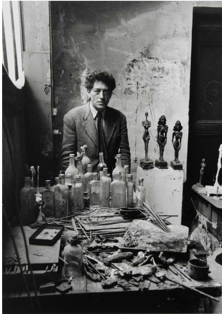
Alberto Giacometti, 1954