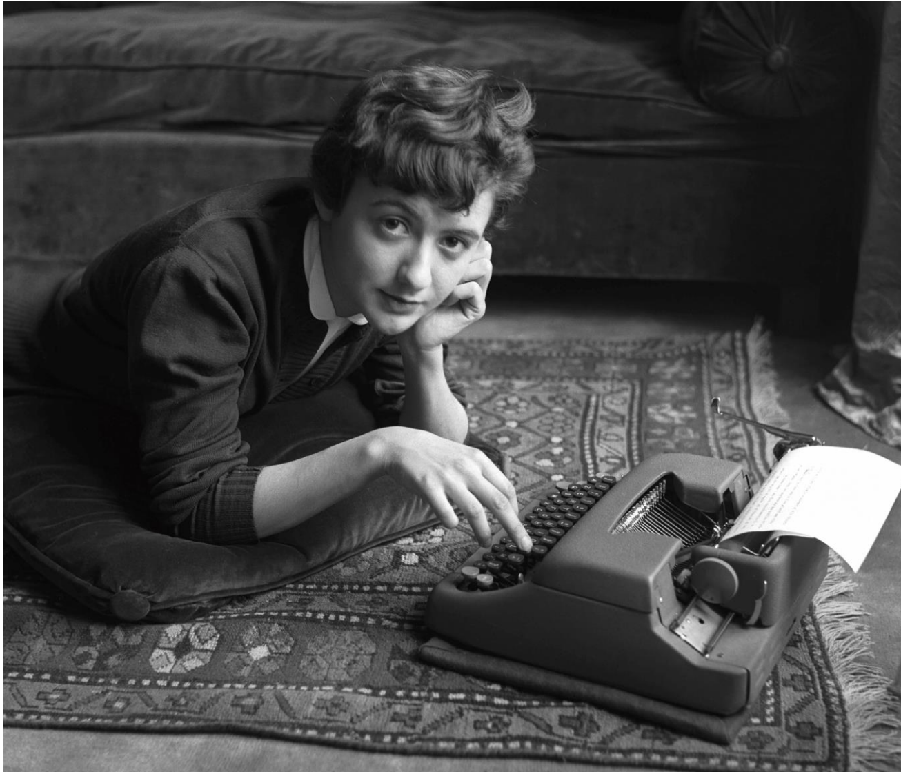
Françoise Sagan, 1954