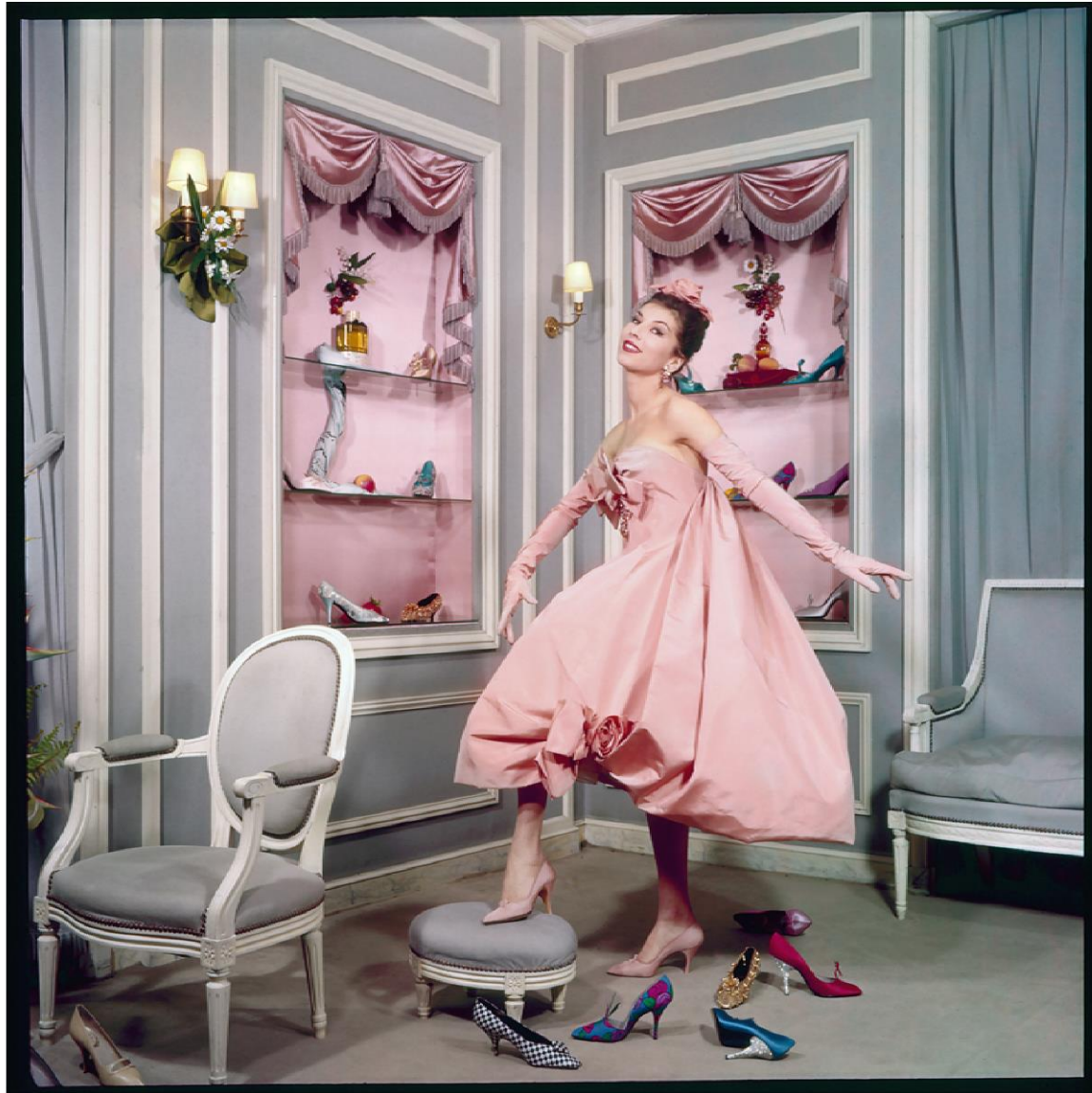
Chez Dior, 1958