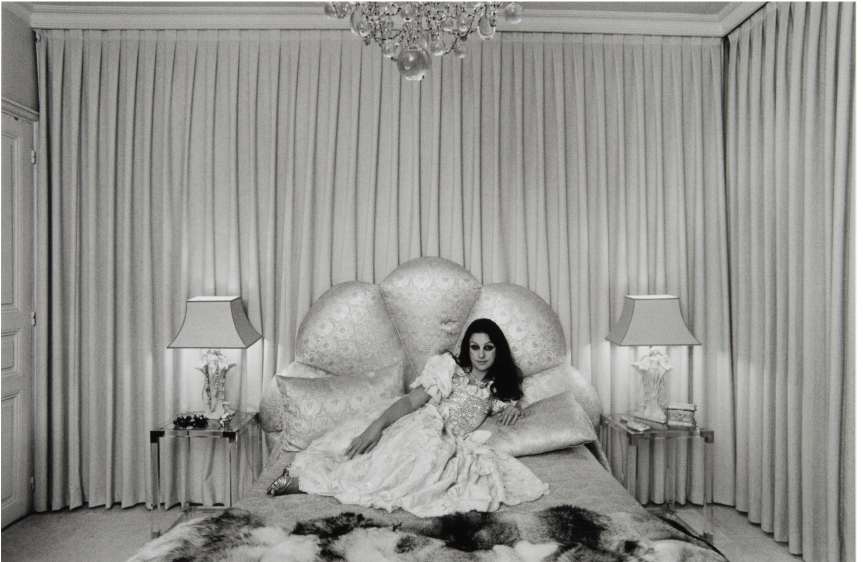
Val de Marne, 1986