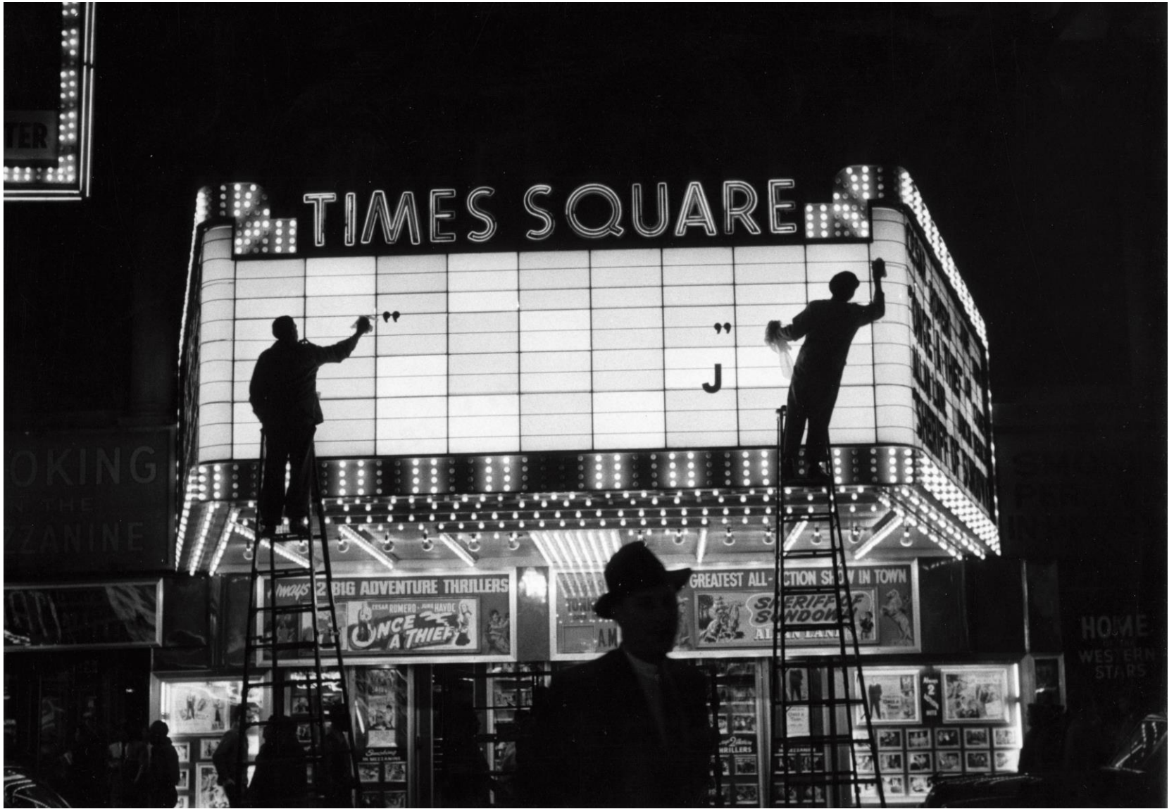
New York, 1955