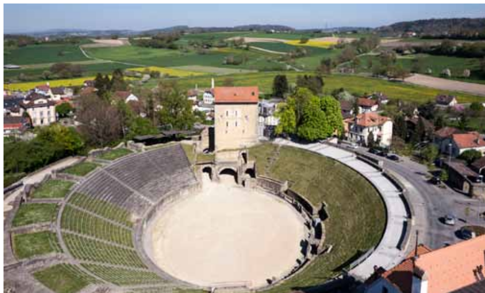
LE MUSÉE ROMAIN D'AVENCHES, installé dans une tour du XI e siècle, domine l'amphithéâtre romain.