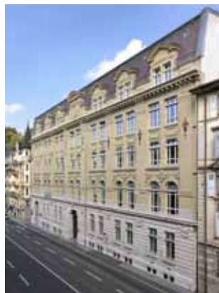
BÂTIMENT DE LA RUE DU DR CÉSAR-ROUX 19 À LAUSANNE, rénové pour accueillir la Haute École de Santé Vaud (HESAV).