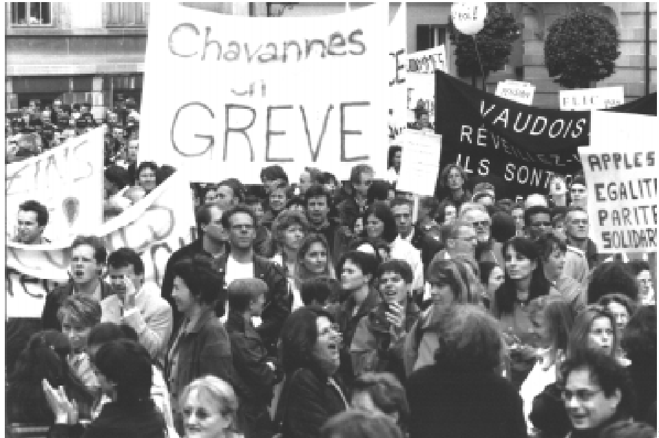
6 octobre 1998, place du Château