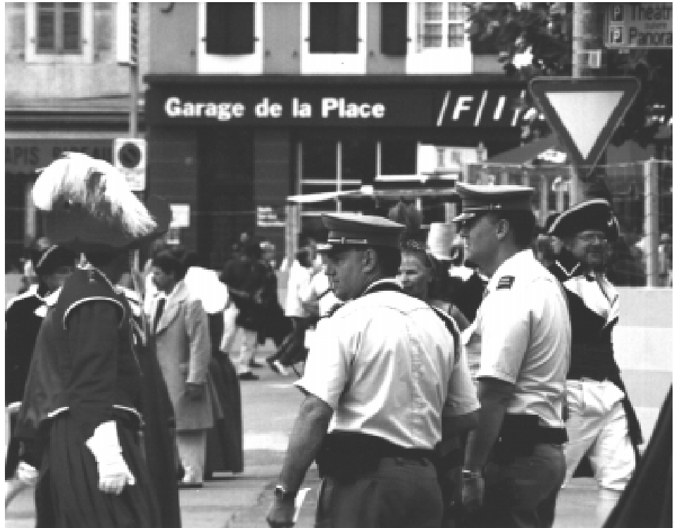
Dans la ville en liesse, deux agents au milieu des figurants, sur la place à deux pas des arènes de la dernière Fête des Vignerons que Vevey aura connue ce siècle.