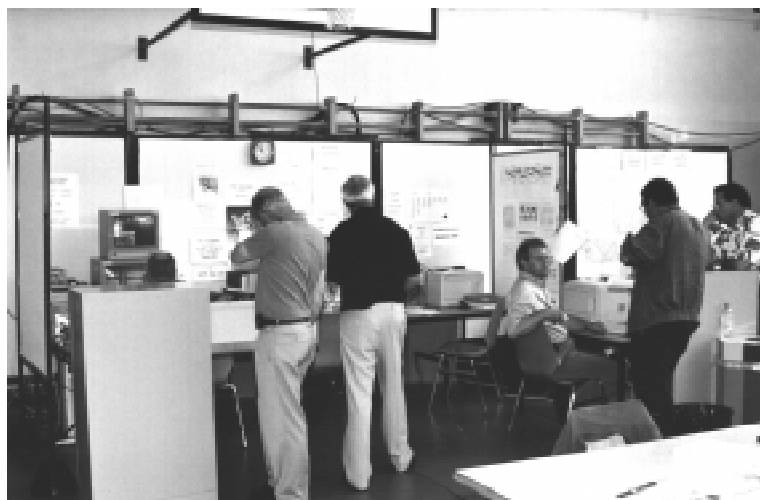
Tous les acteurs de la sécurité étaient réunis au Centre d'engagement et de coordination.