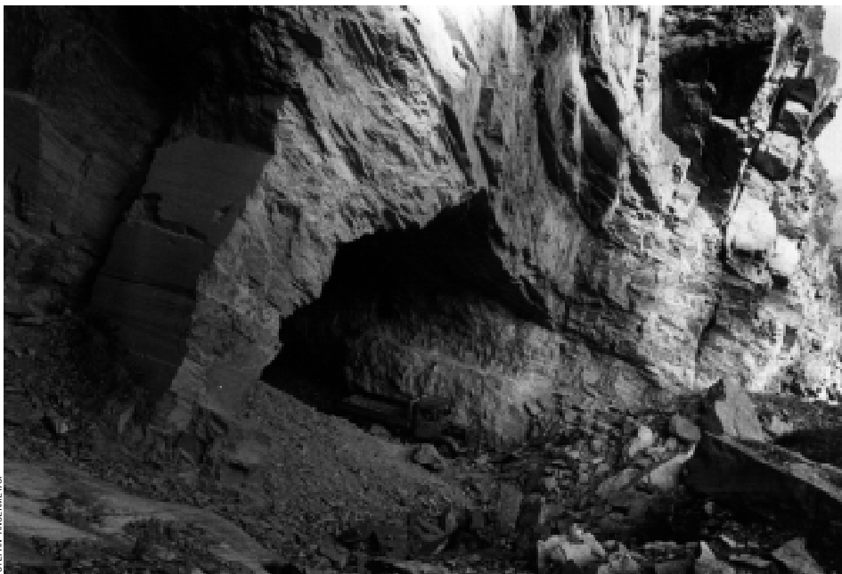
Carrière de marbre de Saillon: entrée de l'exploitation souterraine en 1998. Le camion abandonné, au bas de l'image, donne une idée de l'échelle.

Jusqu'au 21 mars, le Musée cantonal de géologie présente la variété des pierres et roches qui ont servi dans nos régions à la construction et à la décoration intérieure.