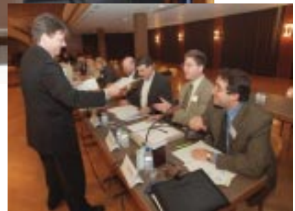
Tous les partis et les principales associations faitières ont répondu présent, sauf les syndicats.