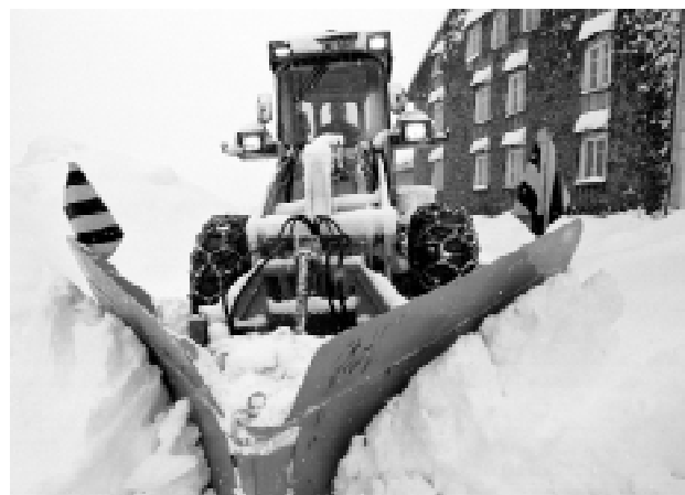
Indispensable de s'adapter aux conditions locales! (ici le déneigement d'une route dans la Vallée de Joux)

le but du service hivernal est d'assurer une bonne sécurité aux usagers de la route, ceux-ci devant néanmoins adapter leur équipement et leur comportement aux conditions locales.