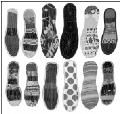
Semelles fabriquées par des femmes avec du tissu de récupération

Le Musée des arts décoratifs de Lausanne a donné carte blanche à François Dautresme jusqu'au 19 mars.