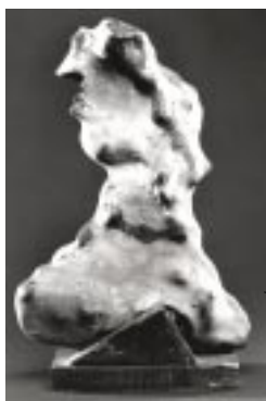
«L'Erynnie», silex, 1948-49

Il les présenta dans des congrès scientifiques comme des découvertes archéologiques. Mais on le soupçonna d'avoir retouché les silex, et il fut proscrit des milieux scientifiques.