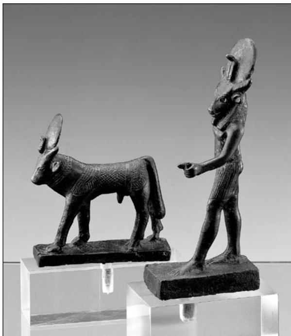
Figurine de taureau Apis marchant (bronze). Égypte, 664-525 av.JC. Ere hybride à tête de taureau. (bronze). Égypte, 332-30 av. J.-C. Coll. Bible + Orient.

avec le projet «Musée Bible + Orient», dévoile sous un angle différent. Passionnant. En s'appuyant sur une collection de près de 100 objets provenant de Mésopotamie, d'Égypte, de Syrie ou d'Israël ainsi que sur un cortège de 80 animaux naturalisés, le visiteur se plonge dans une époque, l'Antiquité, qui faisait la part belle à l'animal.