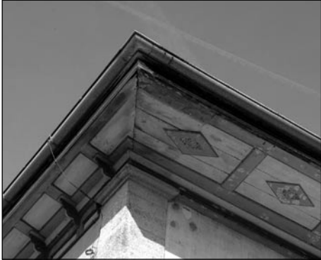
Avant-toit d'une ferme de Prahins. Une parmi les 1000 illustrations de l'ouvrage rédigé par Daniel Glauser.

D u Gros-de-Vaud à la Broye: en se dévoilant au public le 12 mai dernier, le 4 e et dernier opus de la série les Maisons rurales du canton de Vaud marque à sa façon le Bicentenaire du canton. Un canton qui se caractérise par une grande diversité de territoires et d'habitats et dont le présent ouvrage s'attache à décrypter la douceur des paysages entre la Broye et le Gros-de-Vaud. La maison paysanne s'adapte au pays. Elle abrite le pressoir et la cave à vin dans les zones viticoles (Vully et plateau d'Echallens). La culture du blé et des céréales marque surtout le Gros-de-Vaud, considéré longtemps comme le grenier du canton. Les maisons y sont cossues et re-étaient notamment l'opulence de la première moitié du XIX e siècle, l'âge d'or de l'agriculture de cette région. Dans les parties plus élevées – le Jorat et la Haute-Broye – la maison est souvent plus petite et le bois y reste bien présent. L'explication des diverses formes d'architecture rurale en fonction de pratiques d'exploitation parfois ancestrales – et leur mise en perspective dans un contexte géographique et économique – permet de mieux comprendre un patrimoine attachant, fondement de notre culture régionale.