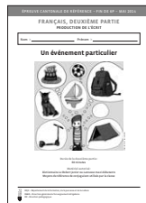
Cahier de l'élève Deuxième partie « Un événement particulier »