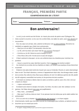
Texte « Bon anniversaire! »

Matériel de l'élève : dictionnaire ( Le Robert Junior ou Larousse maxi débutants ), 1 crayon vert et une règle.