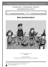
Cahier de l'élève Première partie « Bon anniversaire! »