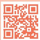
Structure de l'école obligatoire vaudoise