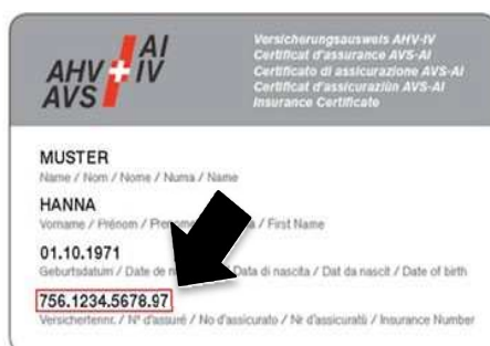
Certificat d'assurance AVS-AI