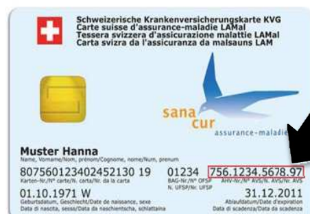
Carte d'assuré maladie