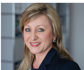
Nuria Gorrite, Conseillère d'État, Cheffe du Département des infrastructures et des ressources humaines

Les routes cantonales assument une fonction importante, celle de relier entre elles toutes les parties du territoire vaudois. La loi confie la charge de leur entretien à l'État et aux communes, et prévoit la possibilité pour ces dernières de bénéficier d'un soutien financier cantonal pour ces travaux.