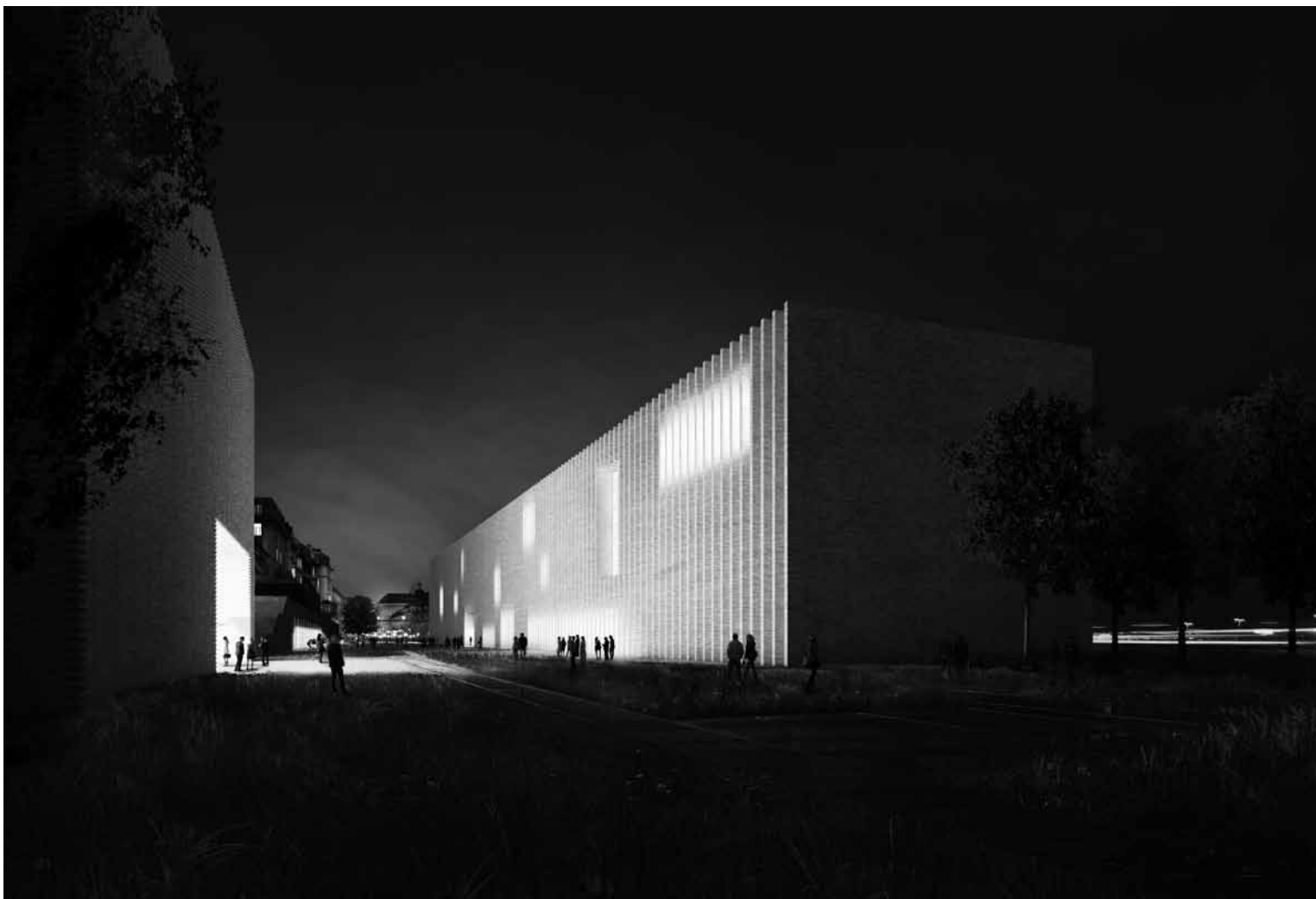
Mudac & Musée de l'Elysée