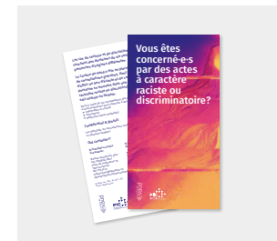
Dépliant « Consultations discriminations »