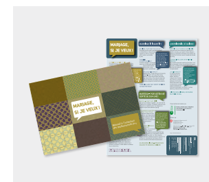
« Mariage si je veux! » • Dépliant informatif • Manuel à l'intention des professionnel-le-s