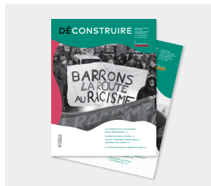
Revue « (dé)construire l'asile » « (dé)construire le racisme »

Disponible en 16 langues, formats numérique et papier : anglais, arabe, dari, espagnol, français, portugais, somali, tigrigna, ukrainien. Format numérique : albanais, allemand, italien, kurde, serbe, tamoul, turc.