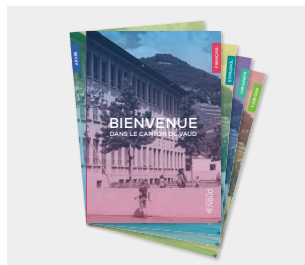
Brochure « Bienvenue dans le canton de Vaud »

Disponible en 16 langues, formats numérique et papier : anglais, arabe, dari, espagnol, français, portugais, somali, tigrigna, ukrainien. Format numérique : albanais, allemand, italien, kurde, serbe, tamoul, turc.