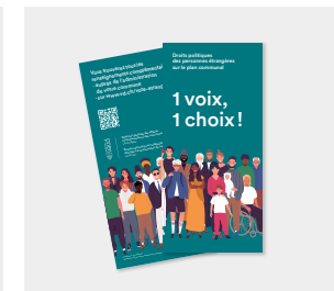
Dépliant « Une voix, un choix »