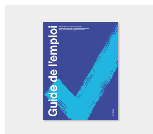
Brochure « Guide pour l'emploi »