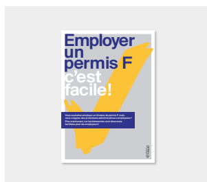
Dépliant « Employer un permis F, c'est facile »