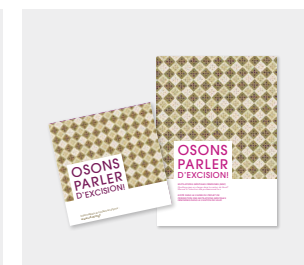
« Mutilations génitales féminines » • Dépliant informatif • Manuel à l'intention des professionnel-le-s Disponible en 6 langues : amahrique, anglais, arabe, français, somali, tigrigna