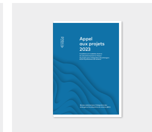
Brochure « Appel aux projets »