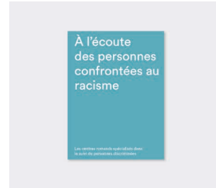
Brochure « À l'écoute des personnes confrontées au racisme »