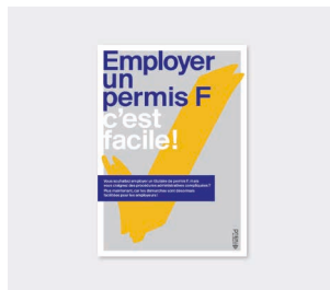
Dépliant « Employer un permis F, c'est facile »