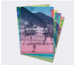
Brochure « Bienvenue dans le canton de Vaud »

Disponible en 16 langues, formats numérique et papier : albanais, allemand, anglais, arabe, dari, espagnol, français, italien, kurde, portugais, serbe-croate-bosniaque, somali, tamoul, tigrigna, turc ukrainien.