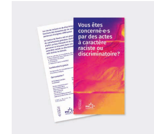
Dépliant « Consultations discriminations »