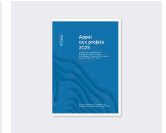
Brochure « Appel aux projets »