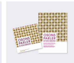
« Mutilations génitales féminines » • Dépliant informatif • Manuel à l'intention des professionnel-le-s Disponible en 6 langues : amahrique, anglais, arabe, français, somali, tigrigna