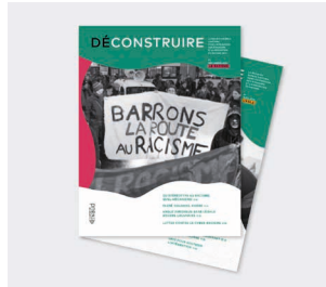
Revue « (dé)construire l'asile » « (dé)construire le racisme »

Disponible en 16 langues, formats numérique et papier : albanais, allemand, anglais, arabe, dari, espagnol, français, italien, kurde, portugais, serbe-croate-bosniaque, somali, tamoul, tigrigna, turc ukrainien.