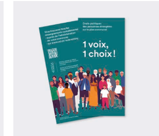
Dépliant « Une voix, un choix »