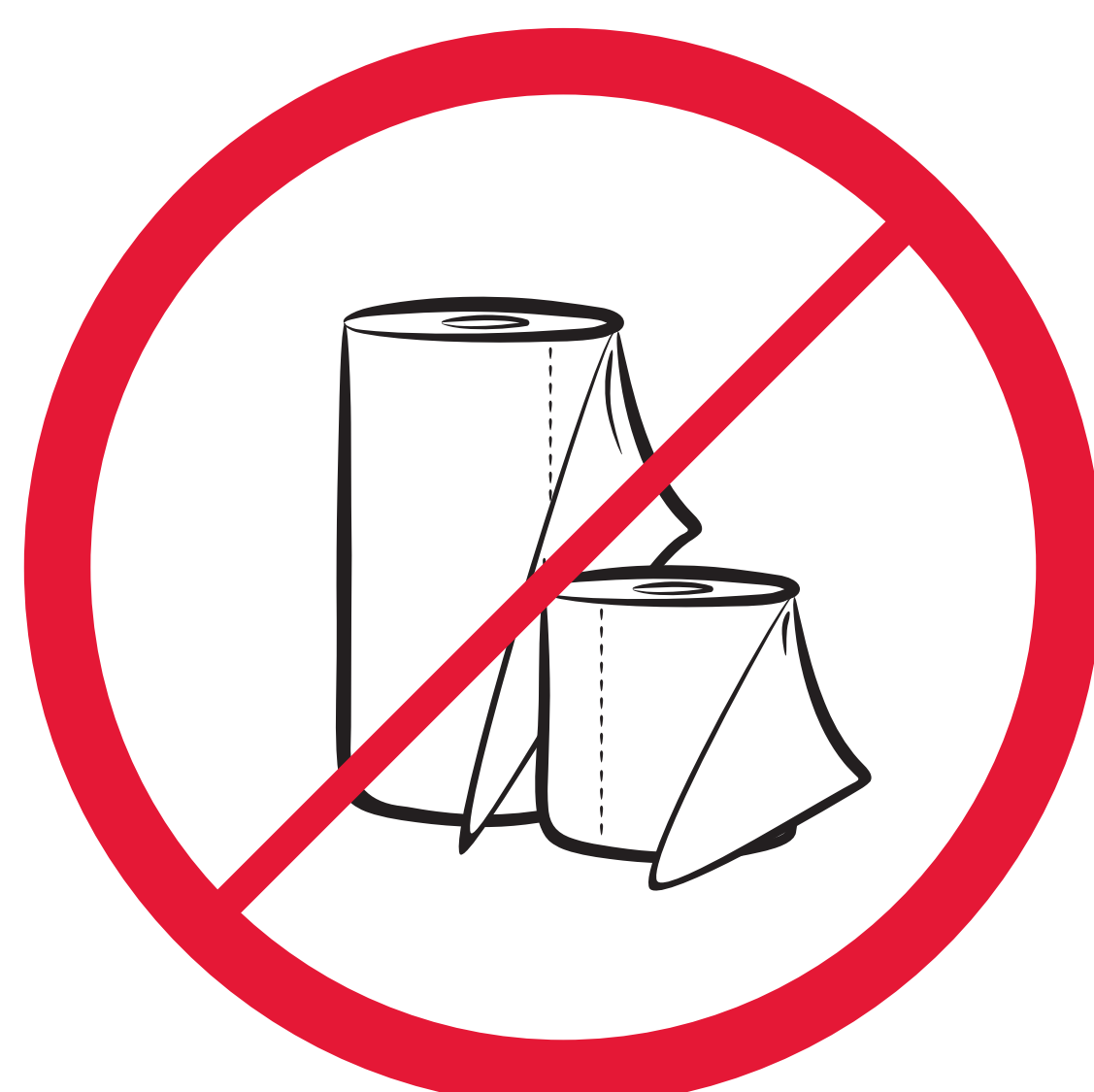
Papierrollen / paper rolls / rouleaux de papier