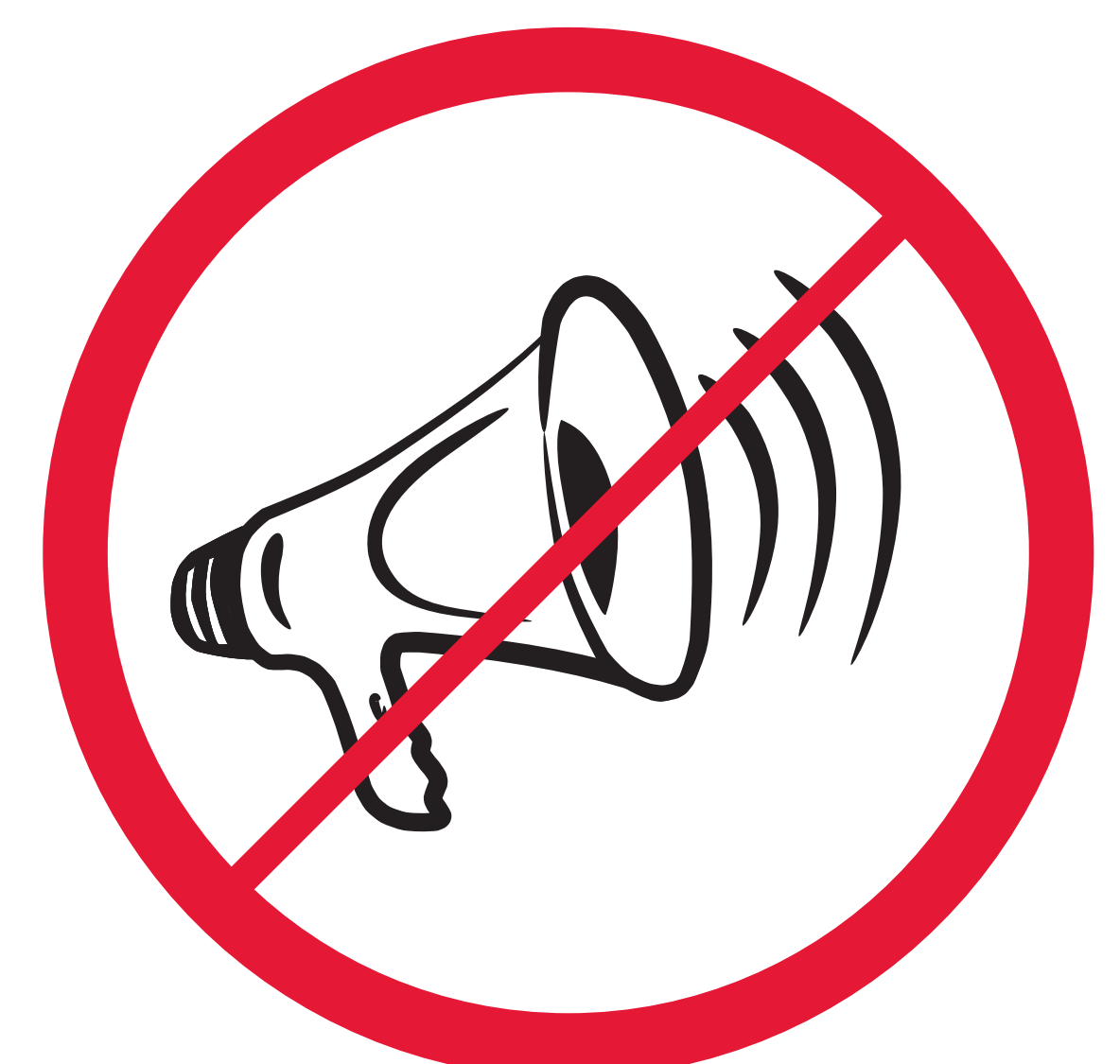
mechanisch oder elektronisch betriebene Lärminstrumente / mechanical or electronic devices such as megaphones / instruments mécaniques produisant du bruit, mégaphones et klaxons