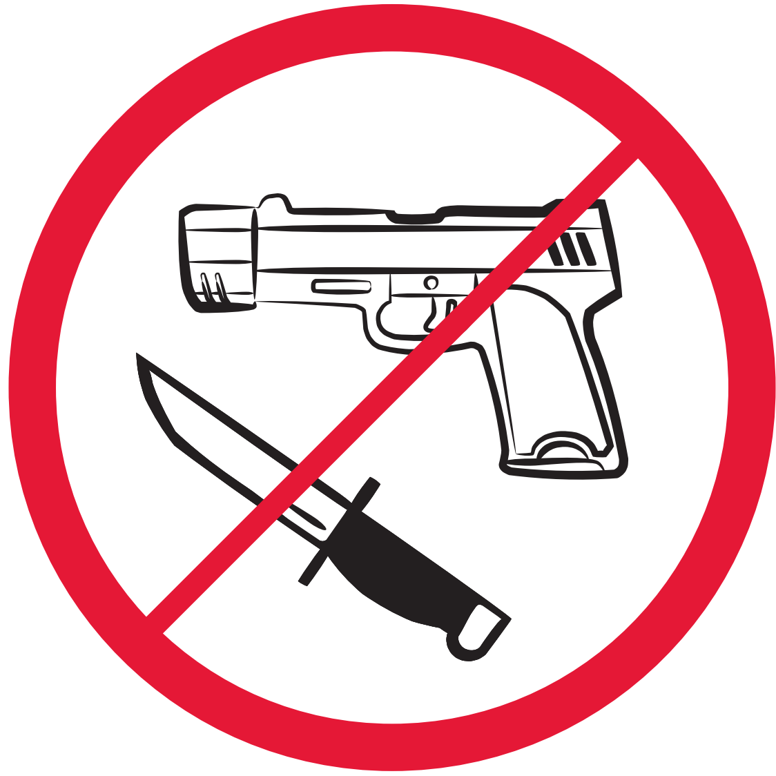
Waffen, gefährliche Gegenstände / firearms, weapons / Armes à feu, armes blanches