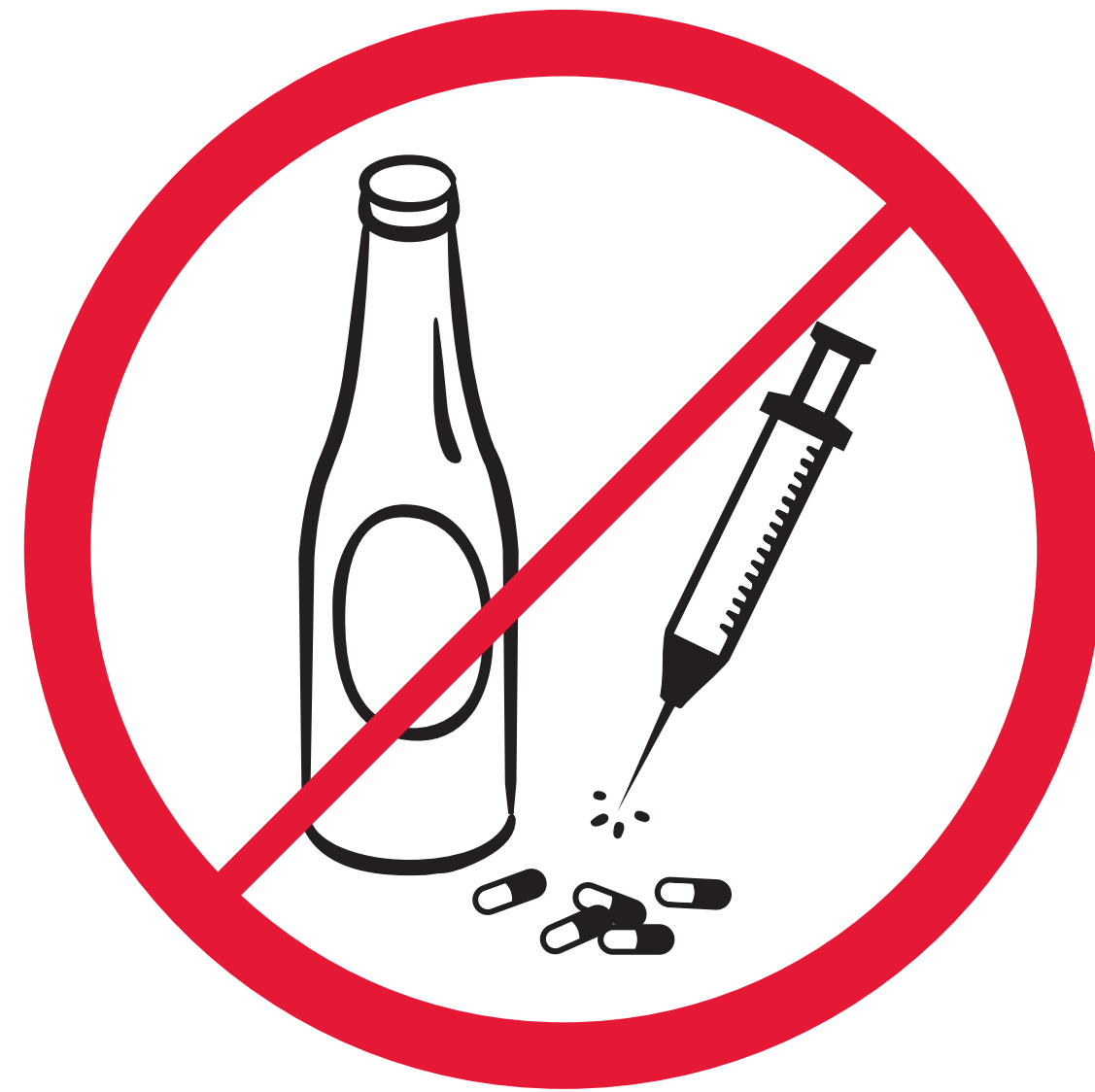
Alkoholische Getränke, Drogen / alcohol drinks, drugs / boissons alcooliques, drogues