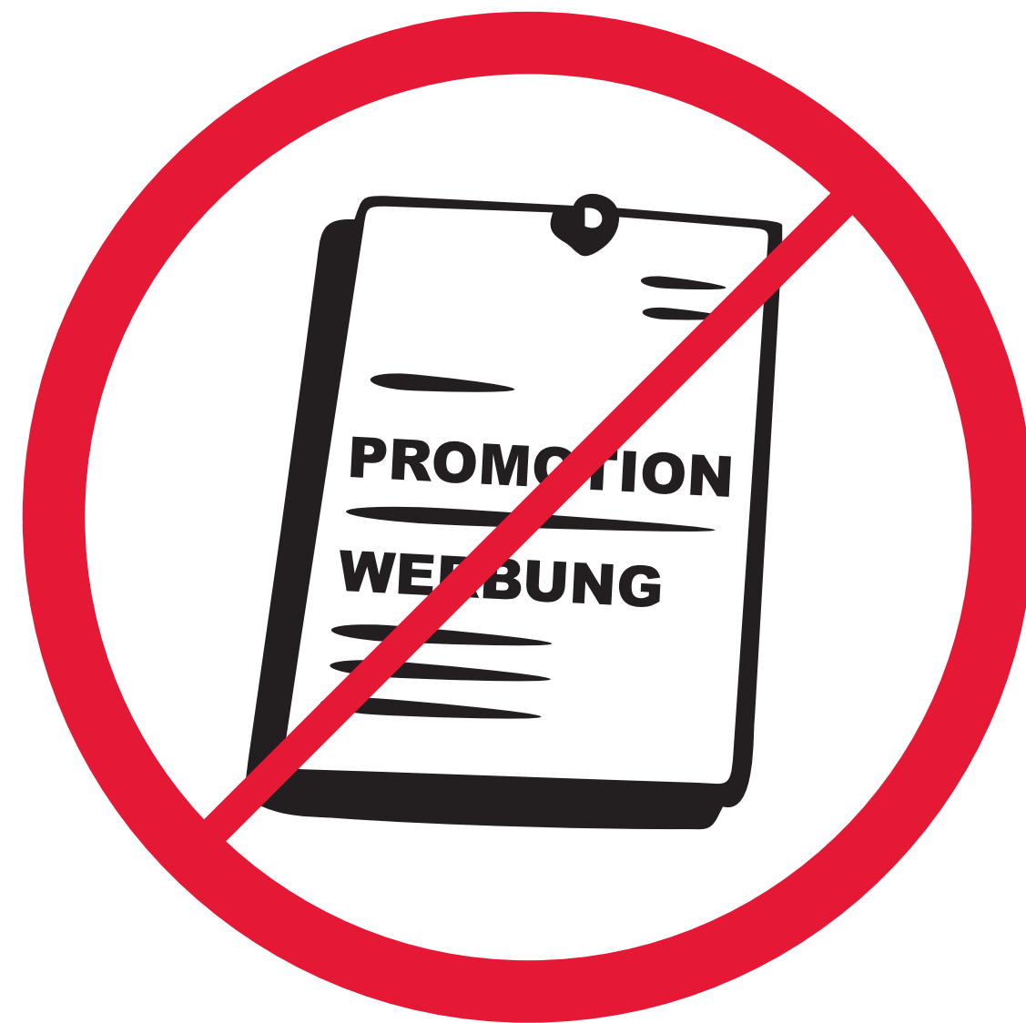
Werbematerial/ -Bekleidung / Promotional materials and clothing / Matériel et habits publicitaires