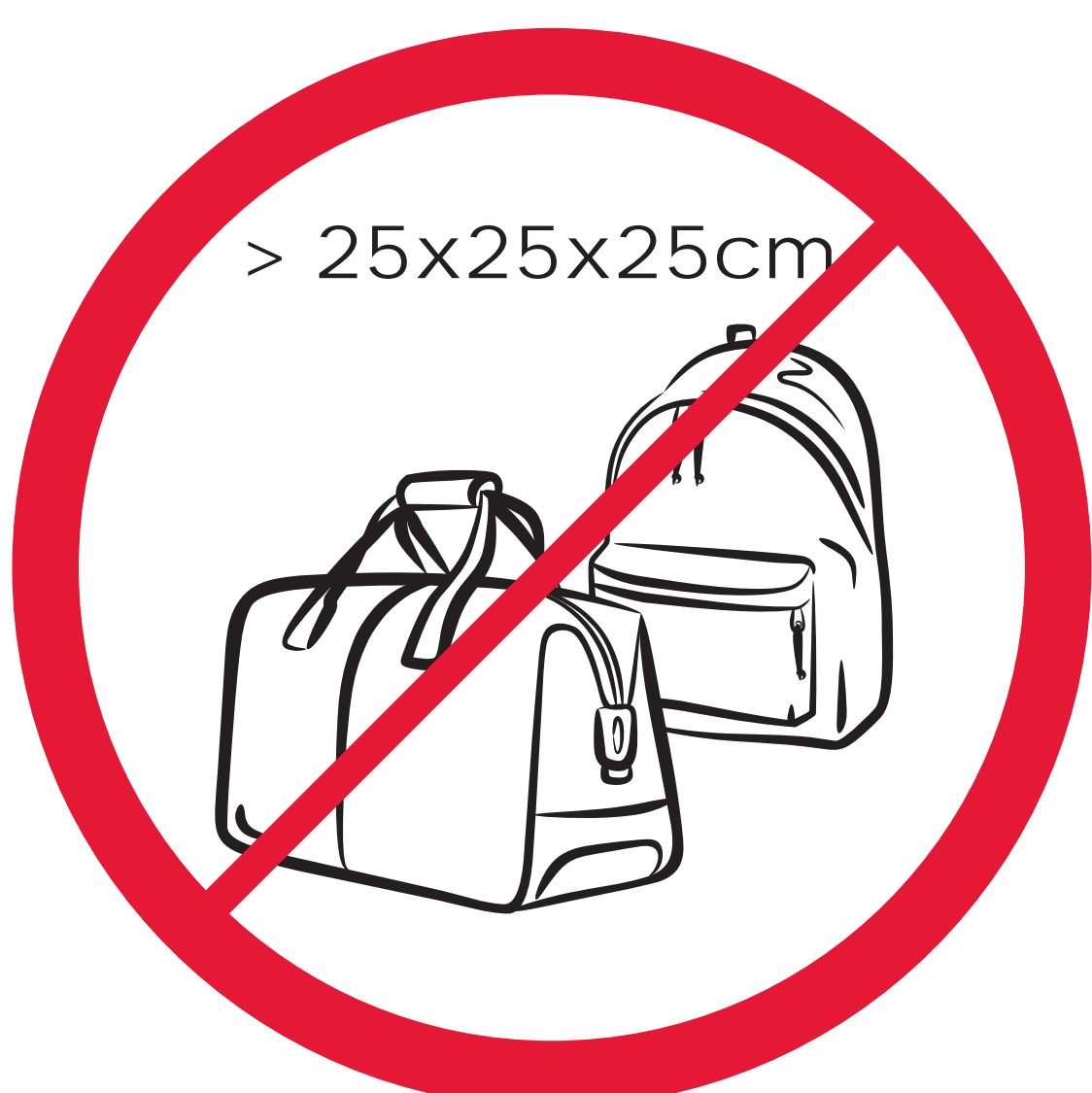
sperrige Gegenstände, (Z.B. Taschen, Rucksack) USW > 25x25x25cm / eg. unwieldy items, large bags, etc > 25x25x25 cm / ex: valises, sacs et objets qui dépassent 25 cm x 25 cm x 25 cm