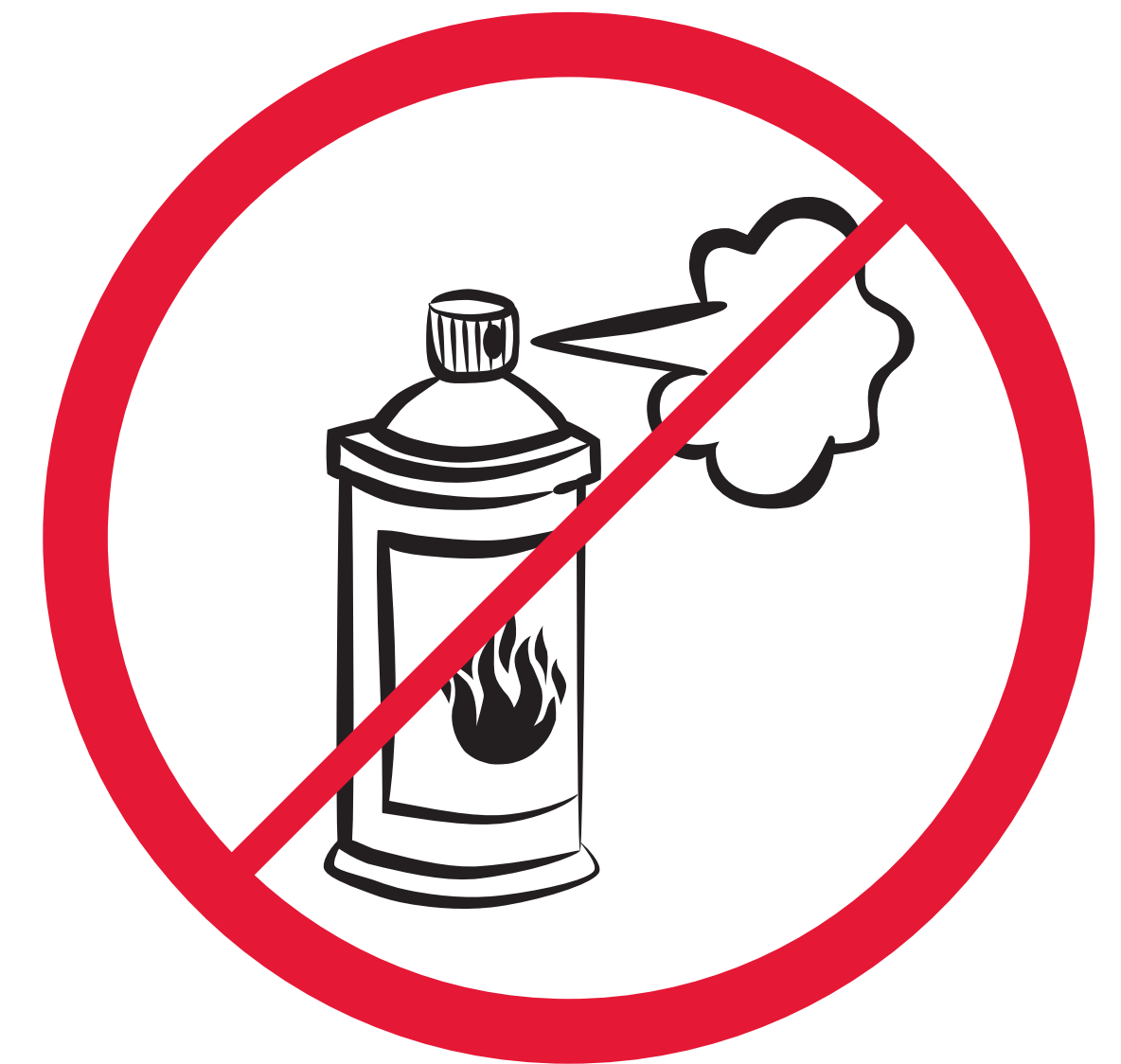
Gassprühdosen / aerosol sprays / sprays au gaz ou inflammables