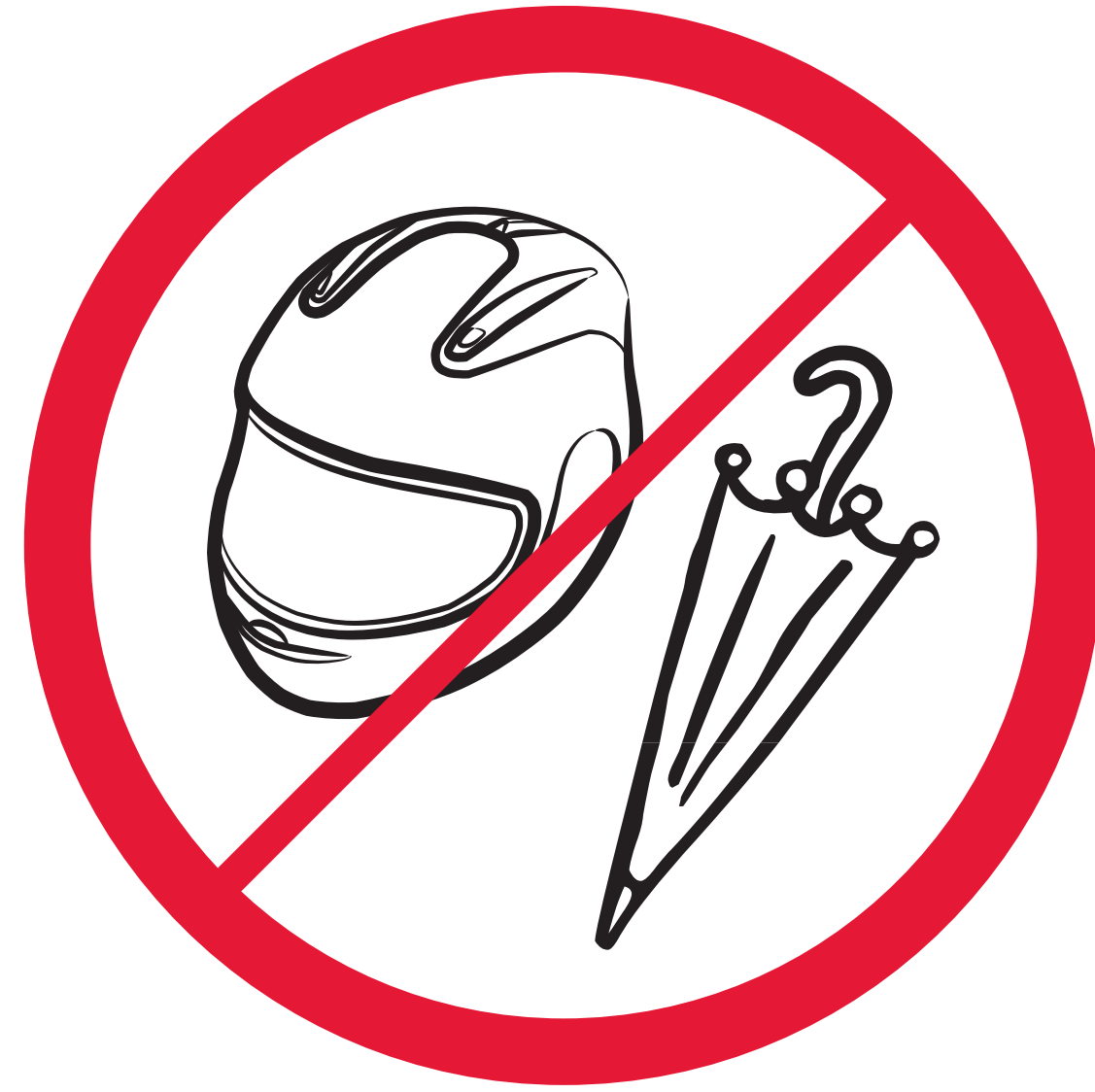
Schirme, Helme / umbrellas, helmets / parapluies, casques