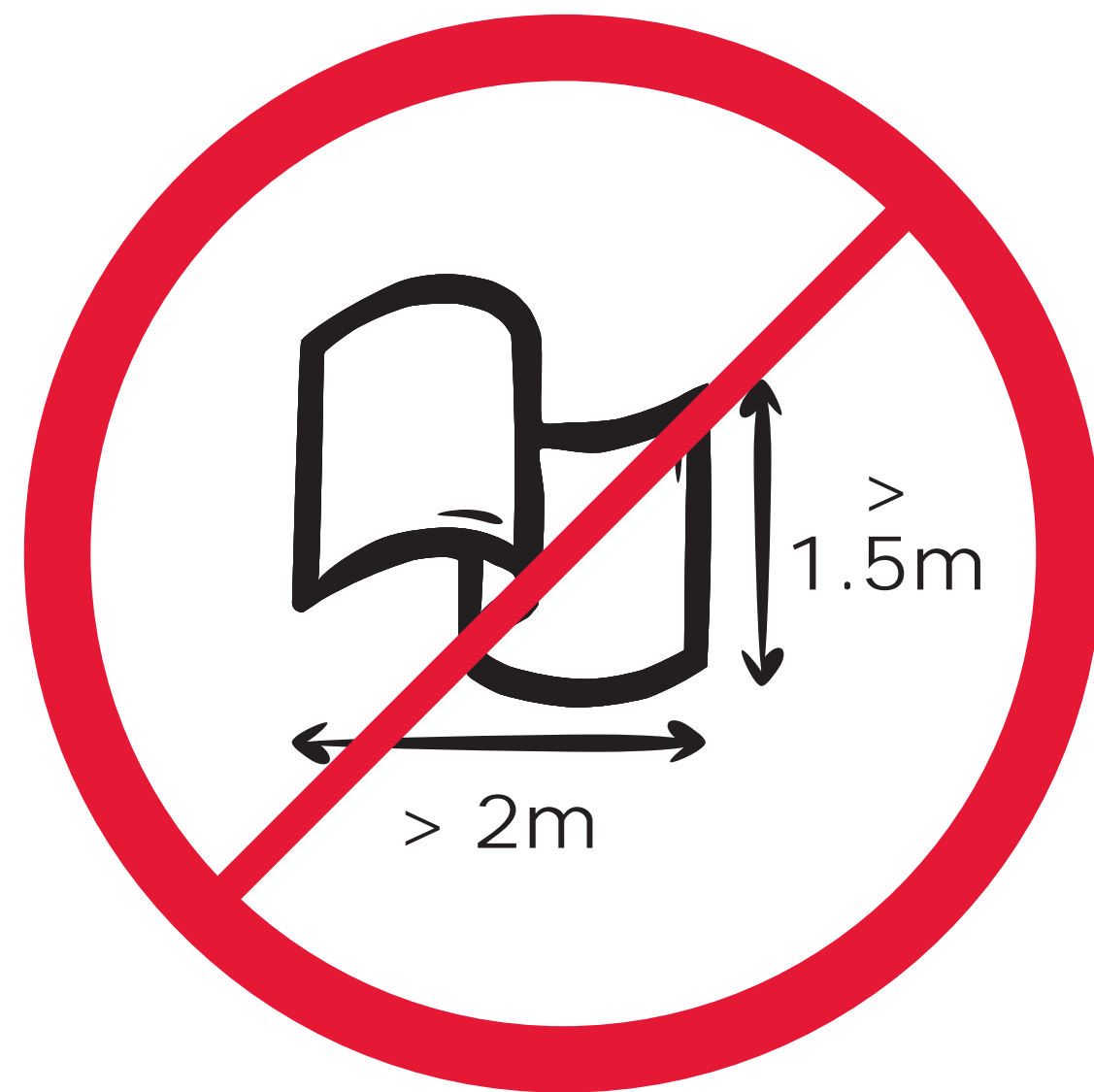
Fahnen, Transparente max 2.0 x 1.5 m / flagsize max. 2.0 m x 1.5 m (6.5' x 5.0') / bannières ou drapeaux dépassant 2 m x 1,50 m