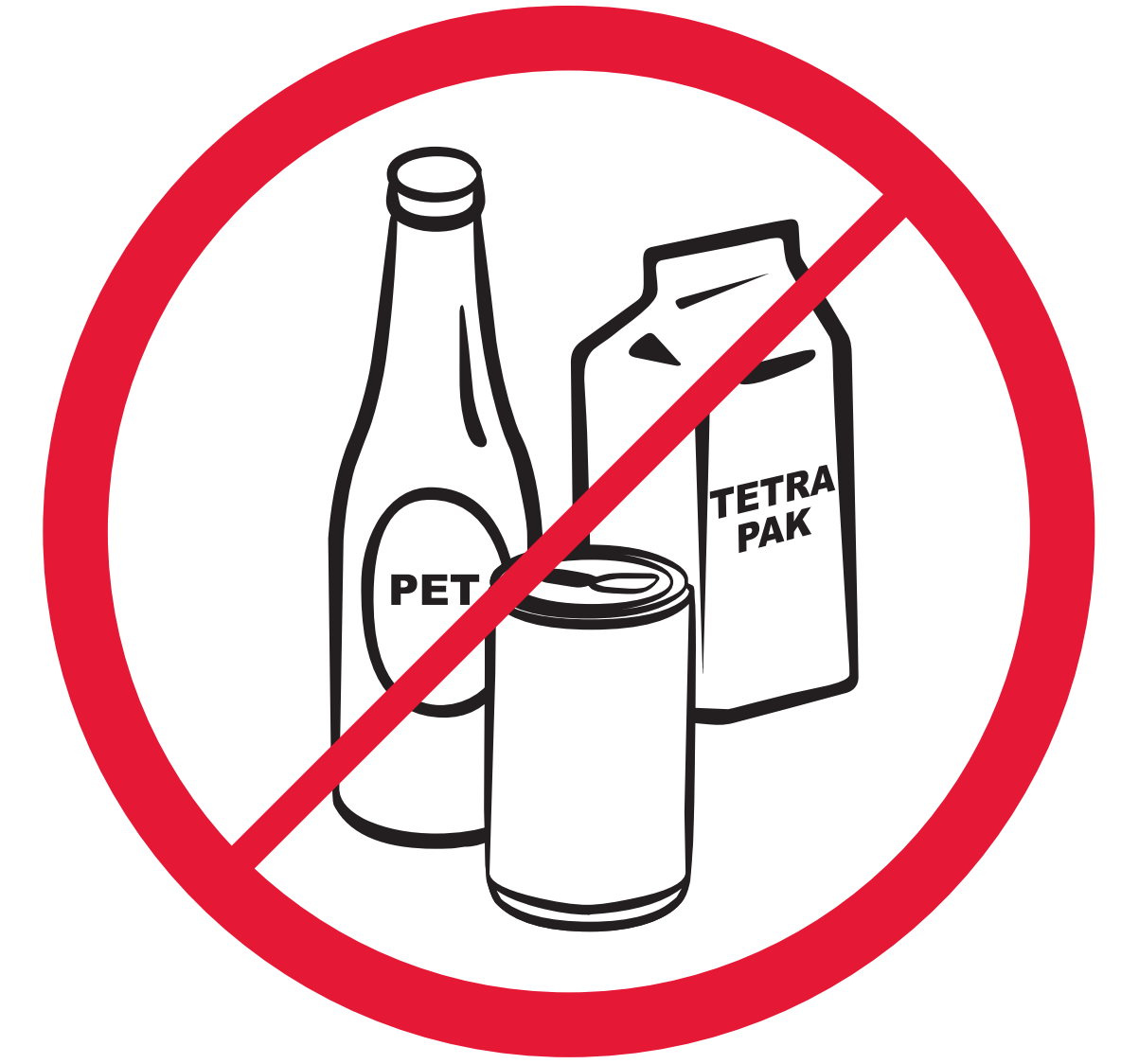
Flaschen, Becher, Dosen etc / glassware and bottles / bouteilles, tasses, carafes, canettes, etc