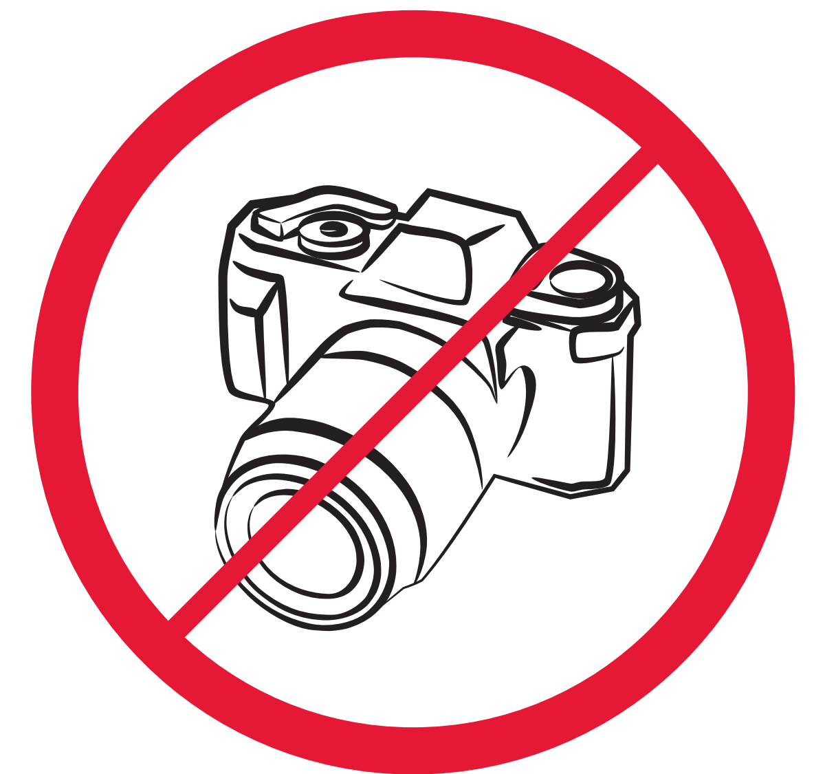
Foto-/Videokameras für gewerbliche Zwecke / cameras/video cameras for business reason / caméras ou caméras vidéo, matériel d'enregistrement