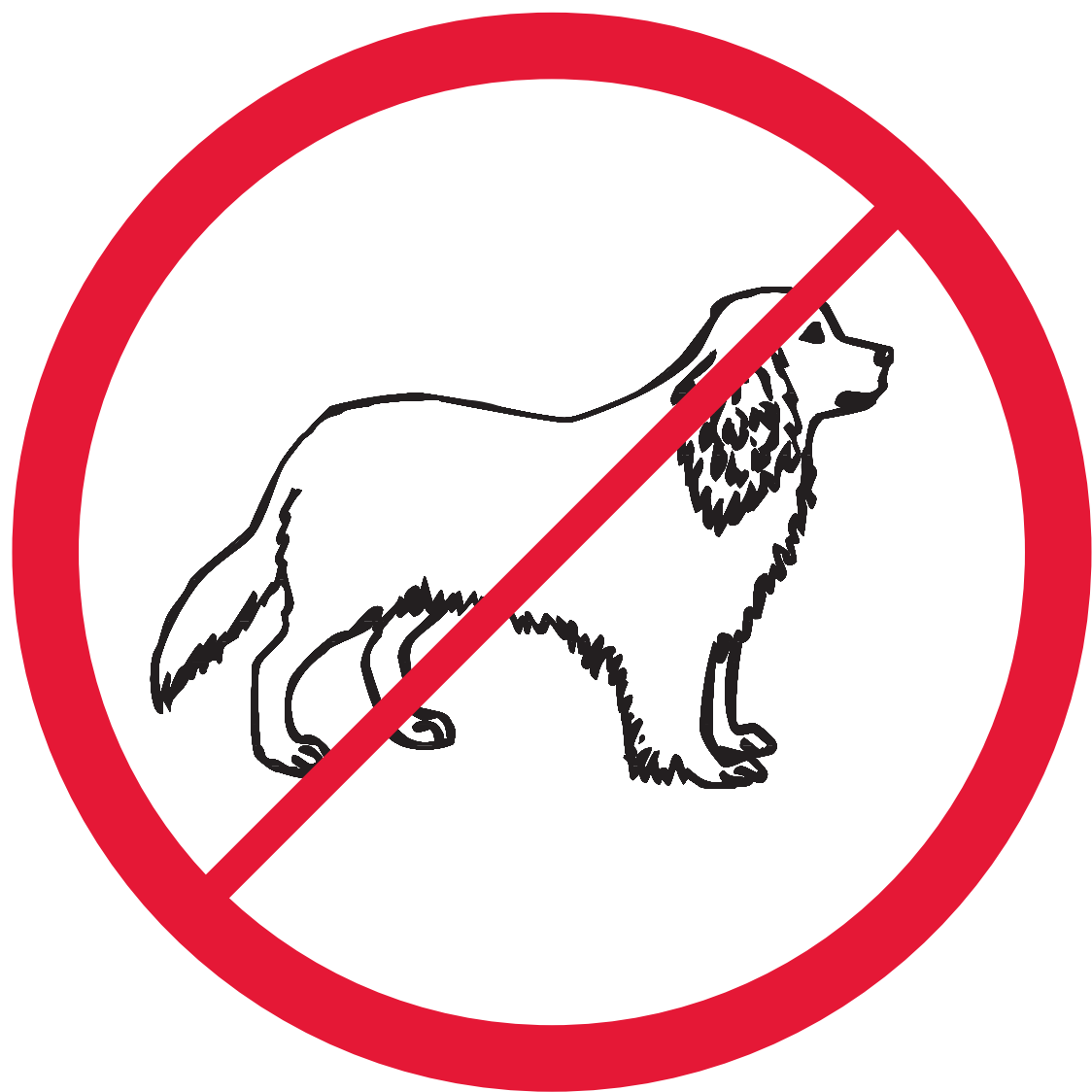
Tiere / animals / animaux