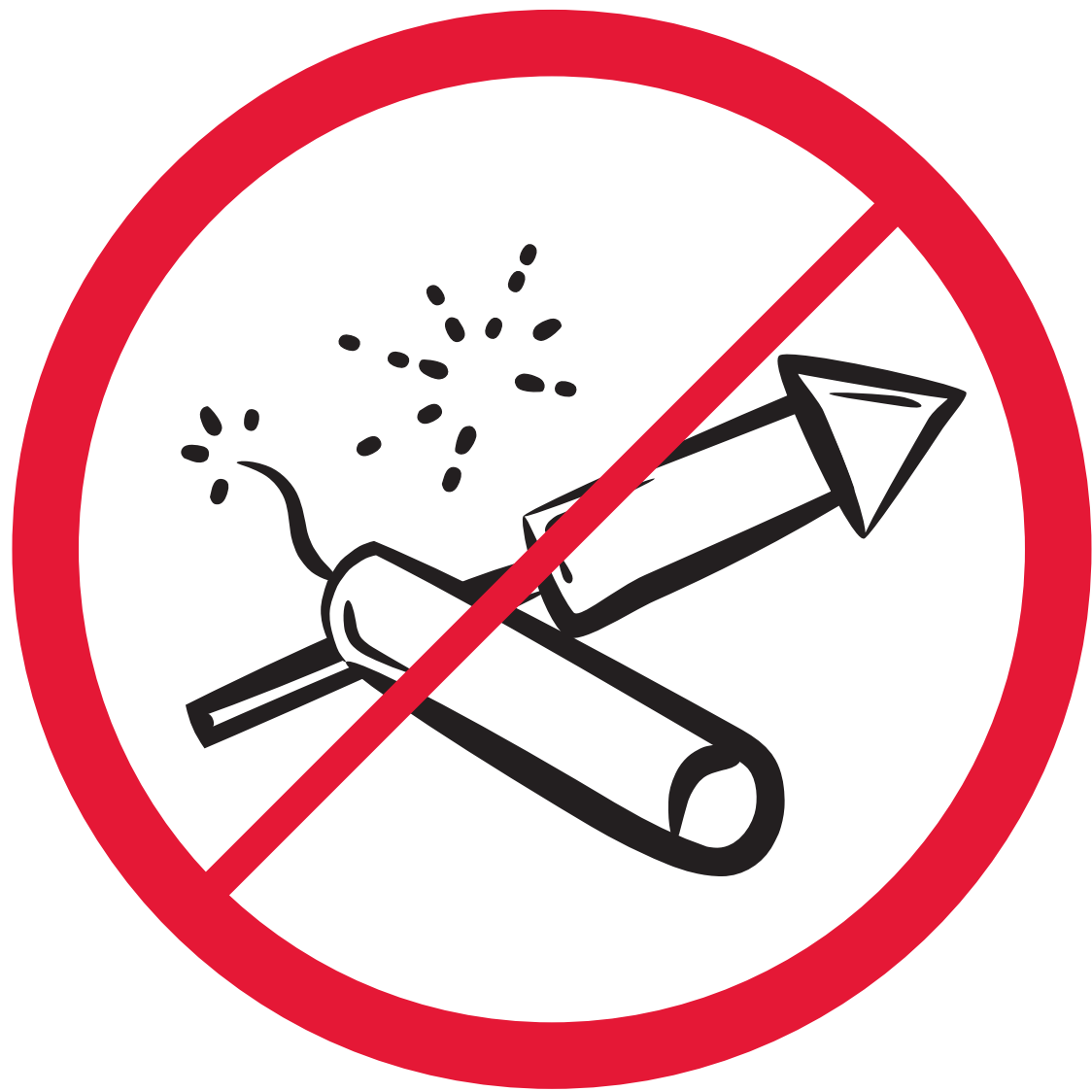
Feuerwerkskörper, Leuchtkugeln, Rauchpulver, pyrotechnische Gegenstände / pyrotechnica / feux d'artifice, poudre de fumée, fumigènes, engins pyrotechniques