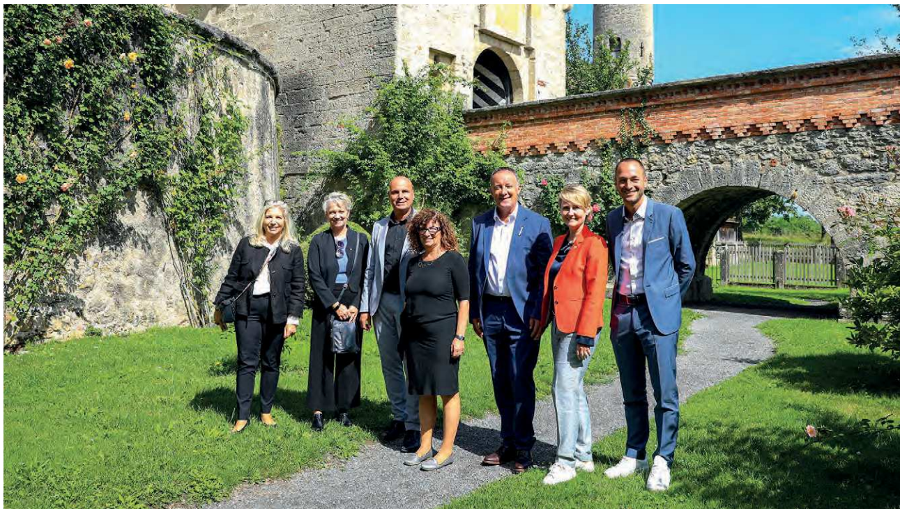
Les conseillères et conseillers d'État des Cantons romands en charge de l'égalité, dont Isabelle Moret, entourée sur la photo par ses homologues, ont signé un accord-cadre avec la HES-SO Valais pour la création d'un centre de compétences romand pour le contrôle de l'égalité salariale entre femmes et hommes.

pour les victimes d'agression sexuelle, quels que soient leur âge, leur sexe, leur identité de genre et leur orientation sexuelle et ce, indépendamment des circonstances de l'agression.