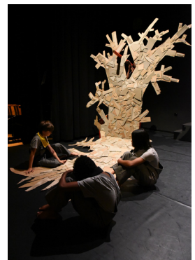
Projet Rougejaunoireblanche, réalisé à l'Établissement de Villamont avec la metteure en scène Delphine Horst