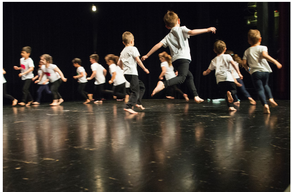
Projet Danse à l'école - En Cie d'Eux