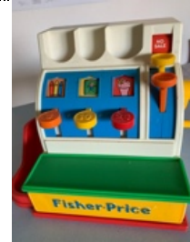
Une caisse enregistreuse

Pour ajouter des lignes Tableau/ insérer/ lignes