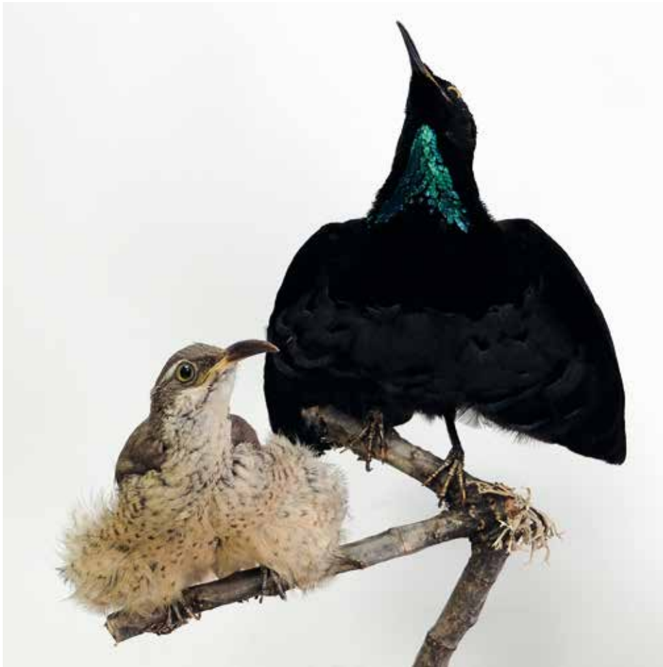
Fig.1 couple de paradisiers.