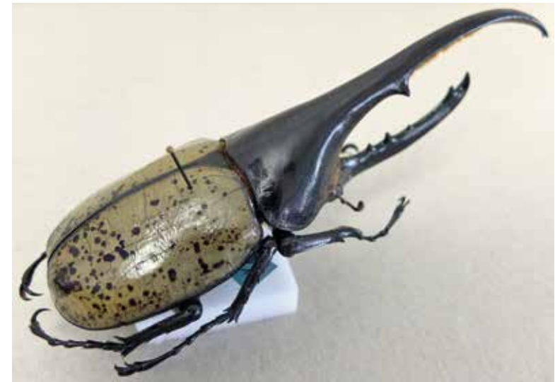
Fig. 4 scarabée rhinocéros mâle. Les scarabées rhinocéros mâles s'affrontent avec leur longue corne sur la tête pour conquérir les femelles.

Lors de la reproduction sexuée, il y a rencontre de deux gamètes compatibles, souvent précédée de celle de deux individus de sexe opposé. ces individus devront se séduire puis s'accoupler. A chaque espèce, ses stratégies.