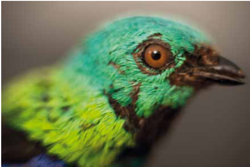
Fig. 5 calliste tricolore mâle. Les couleurs vives du plumage du calliste tricolore mâle sont ses atouts de séduction.