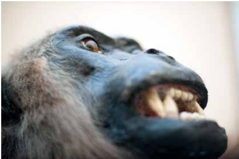
Fig. 3 gorille mâle. chez les mammifères, le genre mâle et femelle est déterminé par les chromosomes sexuels x et y.

généralement, le genre est défini pour toute la vie d'un individu. il est mâle ou femelle. Les hermaphrodites vrais, comme l'escargot, sont simultanément mâle et femelle. D'autres hermaphrodites changent de genre au cours de leur vie (ex. mérou, huître, poisson-clown).