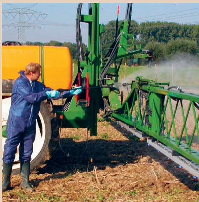
Nettoyage d'un pulvérisateur sur la parcelle, TOPPS

Lors du remplissage et du nettoyage des pulvérisateurs pour les grandes cultures ou les cultures spéciales, il existe un risque de contamination des eaux de surface par les produits phytosanitaires (PPh) concentrés ou par les eaux de lavage (entrées ponctuelles). Cette fiche thématique donne un aperçu des différentes possibilités de remplissage et de nettoyage corrects des pulvérisateurs et de traitement des eaux de lavage. Elle propose aux exploitations agricoles quatre étapes leur permettant de trouver la solution la plus adaptée.