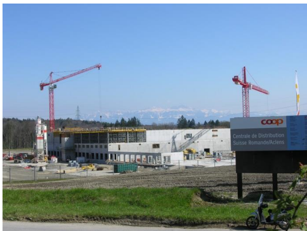
Centrale de distribution Coop à Aclens, 2005-2006