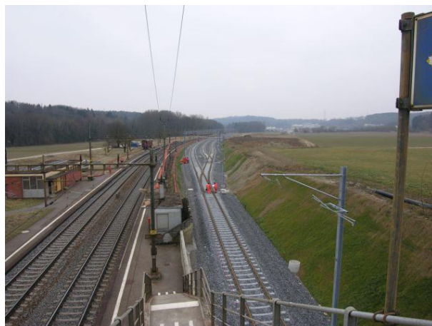
Gare de Vufflens-la-ville avec construction du raccordement ferroviaire, 2005-2006