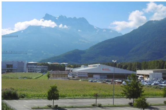
Nord de la ZI voisine des grands commerces