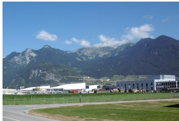
Secteur Est proche de la digue du Rhône