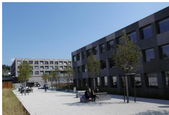
L'esplanade arborée dans la suite de la Terrasse