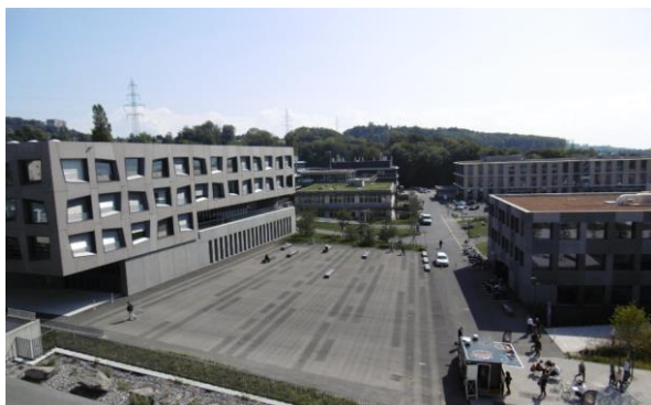
Le Biopôle autour de la Terrasse