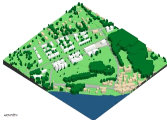
Proposition d'aménagement de la plateforme de la gare de Coppet, nov. 2008, Farra&Fazan - Bovard&Nickl - L'Atelier du Paysage- Transitec - Ecoscan, projet lauréat phase 2 MEP