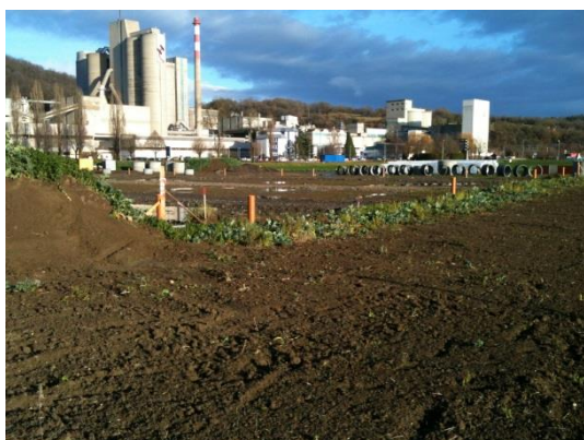
Usine de ciment Holcim, décembre 2011

Lien : http://www.vd.ch/themes/economie/developpement-economique/economie-regionale/projets-cofinances/