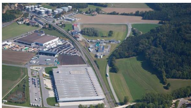
Eclérens, 31 août 2011