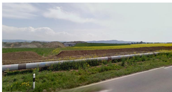
Site de la Poissine