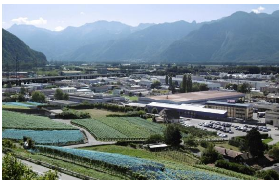
Zone industrielle de Villeneuve

Lien : http://www.vd.ch/themes/economie/developpement-economique/economie-regionale/projets-cofinances/