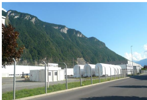
L'entreprise Bombardier dans la ZI de Villeneuve

Crédit photographique : GOP-SDT, 09.2015