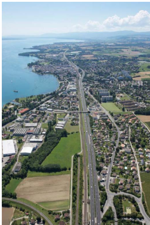
Région morgienne