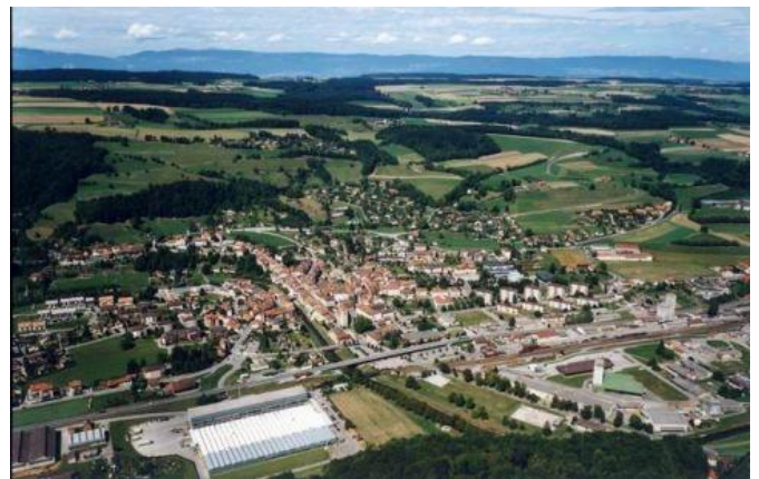
Moudon, concours European, photo aérienne, 2009