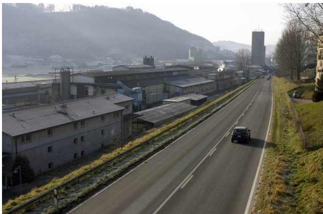
Moudon, concours European, zone d'activités, 2009