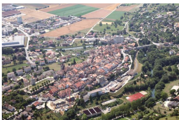
Vue aérienne, commune d'Orbe, GEA, 2006

Liens : http://www.vd.ch/themes/economie/developpement-economique/economie-regionale/projets-cofinances/