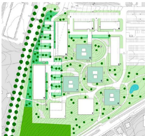
Parc scientifique et quartier de l'Innovation, ADIRHE 2008.